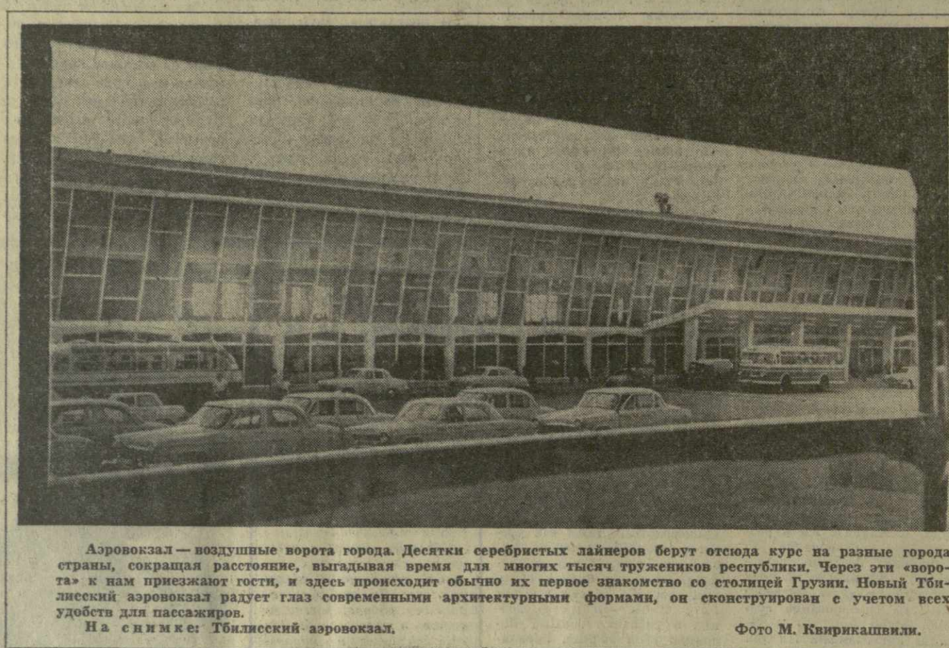
Аэровокзал — воздушные ворота города. Десятки серебристых лайнеров берут отсюда курс на разные города страны...

В будущем году, когда завершится первая очередь строительства, город получит дополнительно 500 литров воды в секунду.