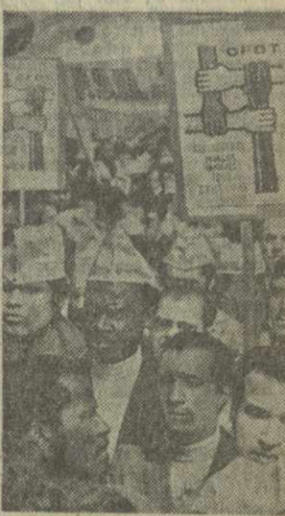
ЛИЦО РАСИЗМА МАРШ ОТЧАЯНИЯ

Весь государственный аппарат ЮАР, крупные силы полиции и жандармерии, вся система расистской юстиции служат для поддержания апартеида в ЮАР. По свидетельству очевидцев, страна уже давно превратилась в настоящее полицейское государство, где жестоко карается всякое проявление недовольства существующим режимом.