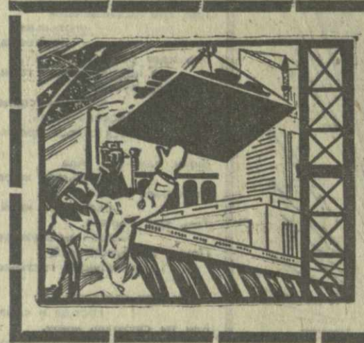
Строители сдают очередной объект строительства в Ингури. На фото: монтажники в процессе выполнения работ.

Трудящиеся Советского Союза! Активно боритесь за осуществление решений XXIV съезда партии, за дальнейшее укрепление экономического и оборонного могущества нашей Родины!