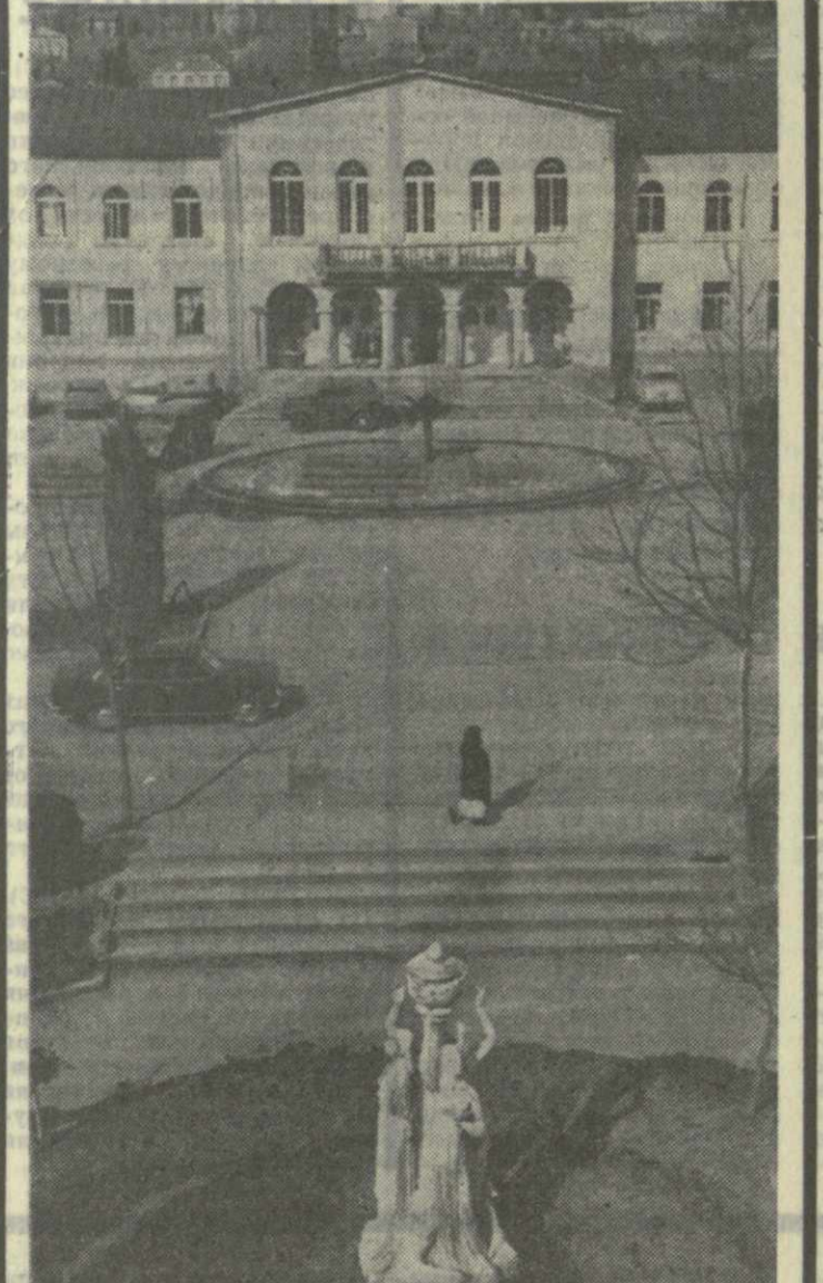
С каждым годом хорошеет, благоустраивается и развивается районный центр Тергола. За последнее время здесь появилось много скверов. Только нынешней весной высажено более 9 тысяч декоративных деревьев.