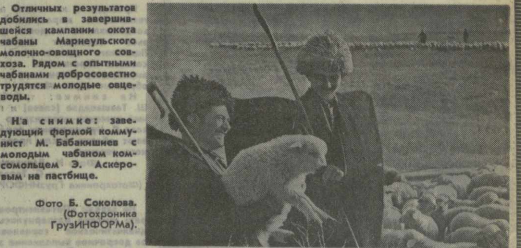
Отличных результатов добились в завершающейся кампания охота чабаны Марнеульского молочно-овощного совхоза. Рядом с опытными чабанами добросовестно трудятся молодые овцеводы.