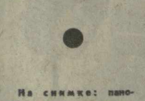
На снимке: панорама курорта Боржом.

С каждым годом хорошеет и благоустраивается курорт Боржом. Здесь сооружаются новые гостиницы и пансионаты.