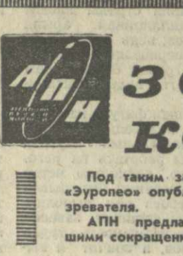
Под таким заголовком итальянский еженедельник «Эурепео» опубликовал заметку своего научного обозревателя.

АПН предлагает ее вниманию читателей с небольшими сокращениями.