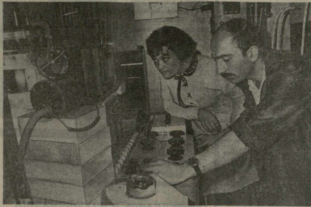
В лаборатории методов регистрации частиц высоких энергий Института физики Академии наук Грузинской ССР разрабатывают и создают приборы для регистрации и изучения свойств элементарных частиц. Недавно в лаборатории создан новый прибор — разрядно-диффузионная камера.