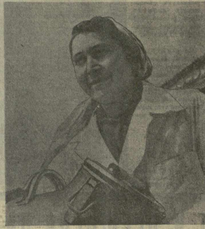
УСПЕШНО РЕАЛИЗУЮТ взятые в социалистическом соревновании обязательства животноводы Дзалинского овощного совхоза Мхцетского района.