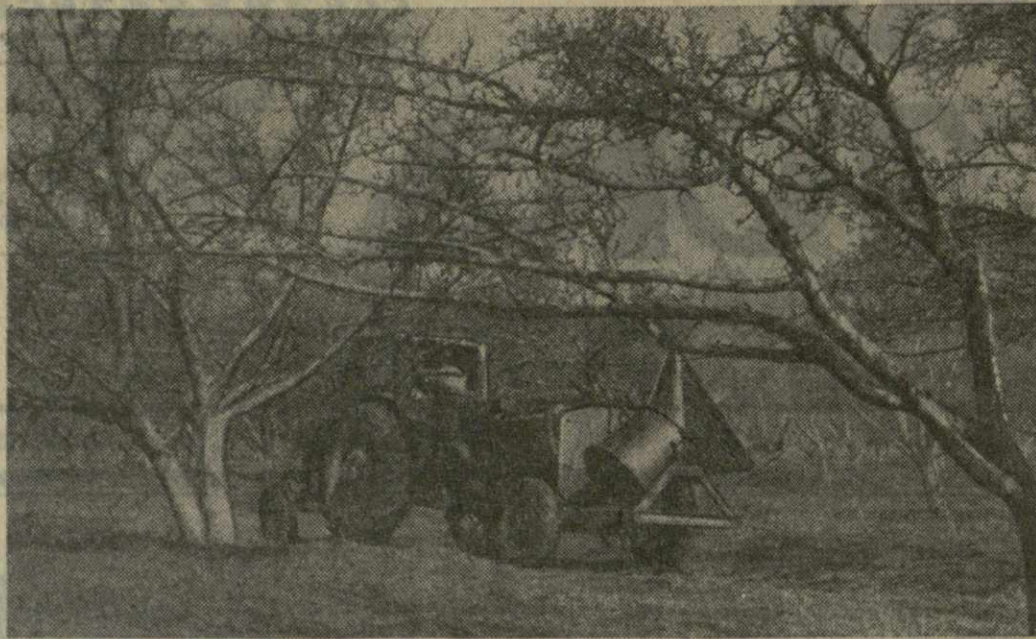
В БЕКМАРСКОМ СОВХОЗЕ Знаурского района в агро-технические сроки производится уход и лечение плодовых садов на площади в 53 гектара.