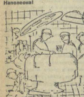
— К черту! Ищите как следует, ведь это сердце только что здесь было!