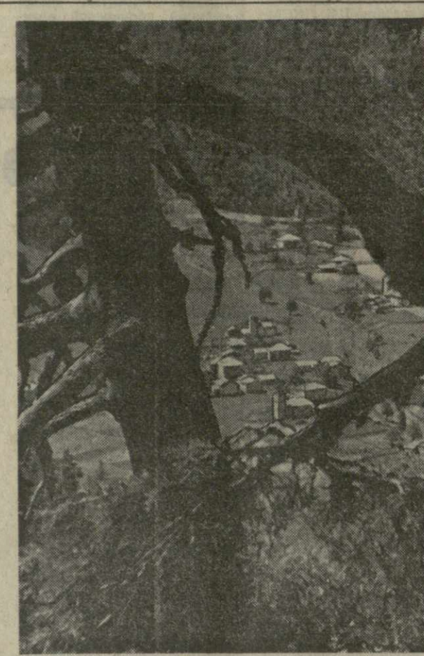
Прекрасна и неповторима весенняя пора в горах. С ледников вниз, в долины, устремляются разбухшие солнцем ручьи и горные потоки.

На снимке: весна в горах Сванетии.