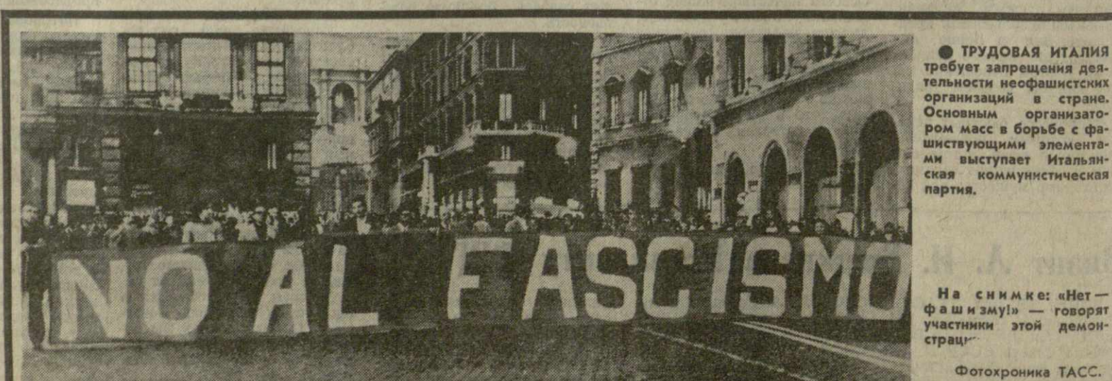
На снимке: «Нет — фашизму!» — говорят участники этой демонстрации.

Облучение производится здесь гамма-лучами радиоизотопа «кобальт-60». Обработанный таким образом картофель не прорастает, клубника и персики дольше хранятся.