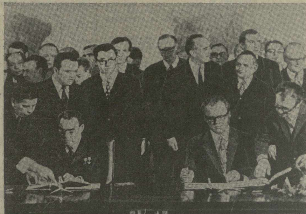
Бонн, 19 мая. Сегодня в министерстве иностранных дел ФРГ в торжественной обстановке состоялось подписание соглашений между Советским Союзом и Федеративной Республикой Германии. Соглашение о развитии экономического, промышленного и технического сотрудничества подписали за правительство Союза Советских Социалистических Республик Л. И. Брежнев, А. А. Громько. За правительство Федеративной Республики Германии — В. Брандт, В. Шеель. На снимке: во время подписания.

За правительство Федеративной Республики Германии В. БРАНДТ В. ШЕЕЛЬ