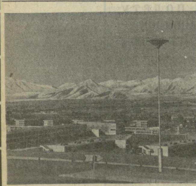
● АФГАНИСТАН. Недавно состоялся первый выпуск специалистов Кабульского политехнического института, который был построен при содействии Советского Союза.

По мнению английских экономистов, подлинное число безработных в стране превышает сейчас миллион человек.