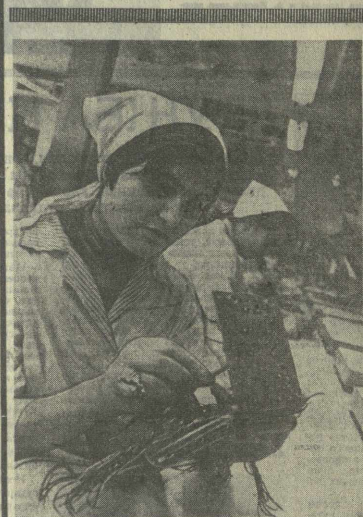
Успешно борется молодежь Тбилисского завода телеграфной аппаратуры за досрочное выполнение заданий третьего, решающего года пятилетия.

Состоялась заседания постоянных комиссий Верховного Совета Грузинской ССР по промышленности, строительству, коммунальному хозяйству и благоустройству, народному образованию и науке.