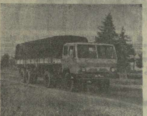
На снимке: новая машина «КАЗ-608-В» в колесной версии «КАЗ-617», разработанная для испытаний москвичами.

внедренный на заводе, обеспечивает надежность и долговечность этого ответственного узла. Автозаводцы позаботились и о повышении качества коробки передач. Новый механизм переключения передач, установленный на «Колхиде», не только упрощает процесс работы водителя, но и увеличивает в несколько раз срок службы выжимного подшипника. Но если на двигатель и все ходовые части машины можно положиться, то, несмотря на улучшение кабины, в ней все еще остается ряд конструктивных недостатков. Проектируя кабину для нового тягача «КАЗ-608-В», кутанские конструкторы учли не только все замечания эксплуатационников, но и олеют лучших предприятий по созданию современных автомобильных кабин. Новая машина отлично прошла государственные испытания. С первого января будущего года страна получит новые «КАЗ-608-В» взамен изношенных серийных «КАЗ-608». Сейчас кутанцы послали один контрольный экземпляр «КАЗ-608-В» своим новым друзьям — коллективу 16-го автокомбината «Главмосавтотранса». Автозаводцы ждут от москвичей отзывов о новой машине. Деловая дружба между заводом и потребителем крепнет. «Зеленой вам улицы и новых побед в труде», — желают московским водителям кутанские автомобильные строители.