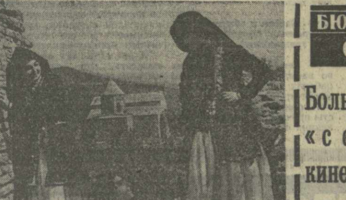
Учащиеся старших классов средней школы села Квемо Алвани Ахметского района активно участвуют в художественной самодеятельности. Школьный ансамбль песни и танца — победитель зонального смотра художественной самодеятельности.