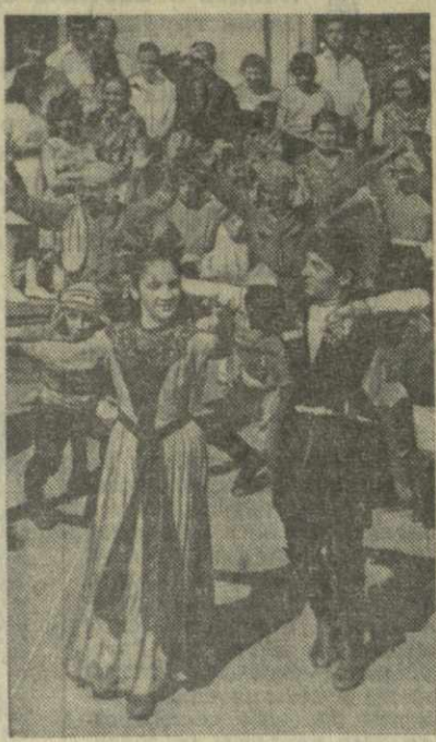
На снимке: выступление танцов Дома культуры Тбилисского электротранспортного завода перед избирательным участком № 62 Ленинского района Тбилиси.

Репортаж вели корреспонденты «Заря Востока» Ф. ИМАШВИЛИ, Д. ШЕЛИЯ, Ш. ГВМИАНИДЗЕ, А. ТАБАТДЗЕ, Л. РОЗЕНБЕРГ.