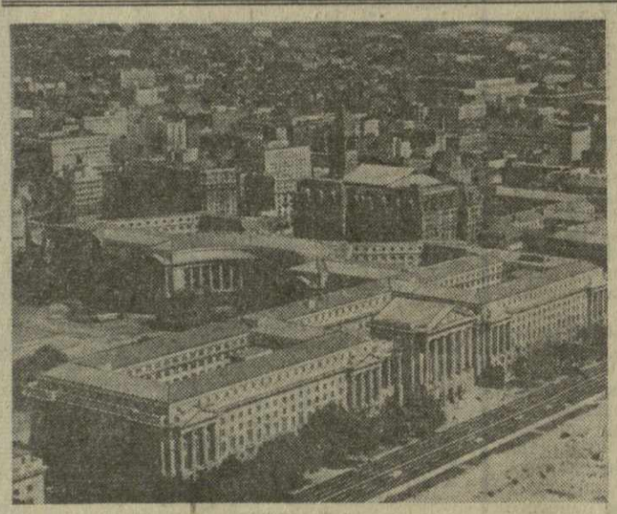
● ВАШИНГТОН — столица Соединенных Штатов Америки. Фотохроника ТАСС.

Касаясь обстановки на Ближнем Востоке, французская газета «Фигаро» сообщает, что Тель-Авив продолжает концентрировать войска и военную технику в районе дианской границы и линии прекращения огня с Сирией. Эта концентрация войск, отмечает газета, расширяется в арабских кругах как подготовка израильской военщины к новой вооруженной провокации против соседних арабских государств.