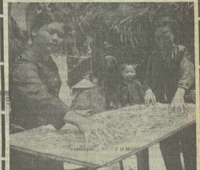
ЮЖНЫЙ ВЬЕТНАМ. Жители районов, контролируемых ВРП ЮВ, гордятся большими успехами, достигнутыми в защите революционных завоеваний, в строительстве новой жизни.

НЬЮ-ЙОРК, 22 июня. (ТАСС). Американский космический корабль «Аполлон» с космонавтами Ч. Конрадом, Дж. Кервином и П. Вейцем на борту привелись сегодня в заданном районе Тихого океана.