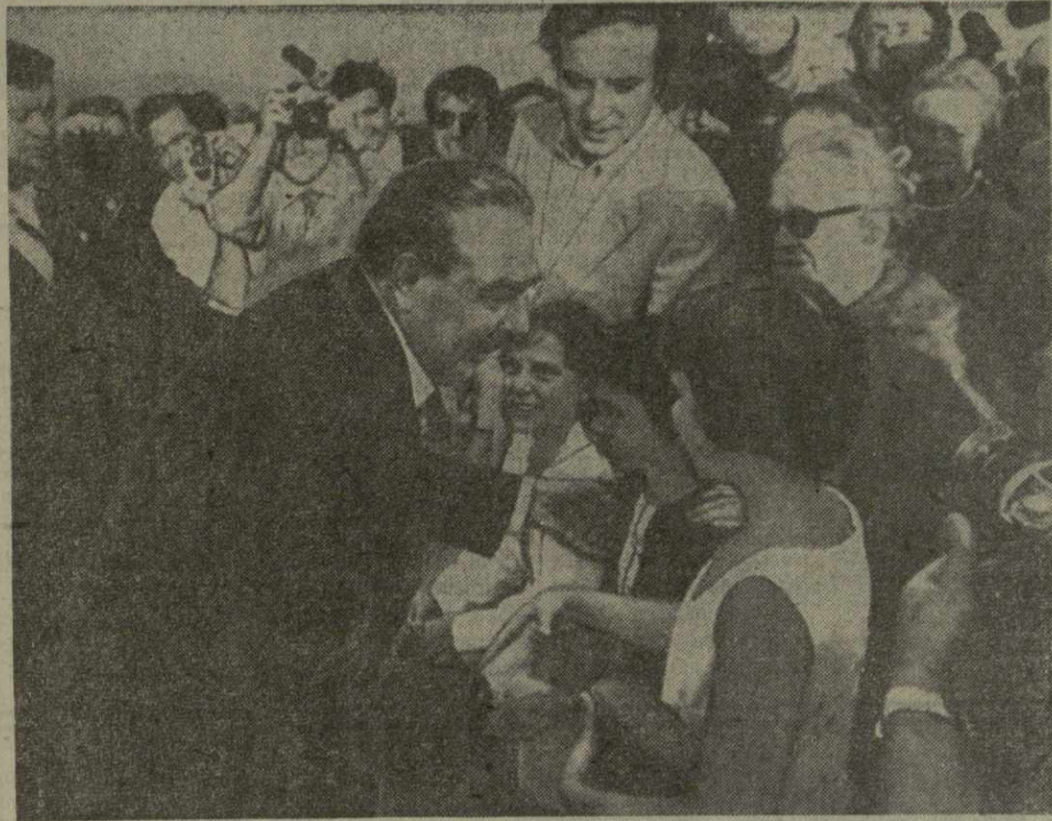
Сан-Клементе (Калифорния), 23 июня. Сюда вместе с Президентом США Р. Никсоном прибыл Генеральный секретарь ЦК КПСС Л. И. Брежнев. На снимке: во время встречи в аэропорту. Жители города приветствуют высокого гостя.

САН-КЛЕМЕНТЕ, (КАЛИФОРНИЯ), 23 июня. (ТАСС). Сюда вместе с Президентом США Р. Никсоном прибыл Генеральный секретарь ЦК КПСС Л. И. Брежнев.