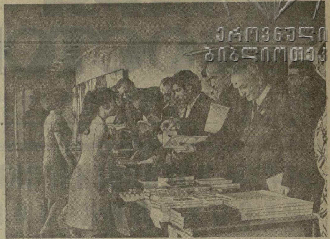
На снимке: участники конференции знакомятся с новинками пропагандистской литературы.