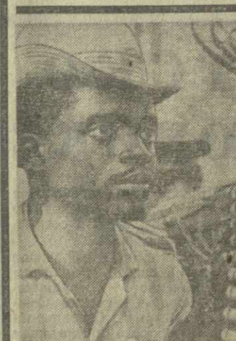
▲ ПАТРИОТЫ ГВИНЕИ (БИСАУ) продолжают наносить ошутимые удары по войскам португальских колонизаторов. Сводки о боевых действиях свидетельствуют о тяжелых потерях противника. На снимке: боец патриотических сил.

▲ В Рувандийской Республике везером утром произошел военный переворот. По сообщению радио Кигали, власть в стране перешла в руки Национального комитета мира и единства. Пришедшие к власти армейские офицеры во главе с министром национальной гвардии Ж. Хабьянманда объявили гражданское правительство низложенным и запретили политическую деятельность в стране по крайней мере на год.