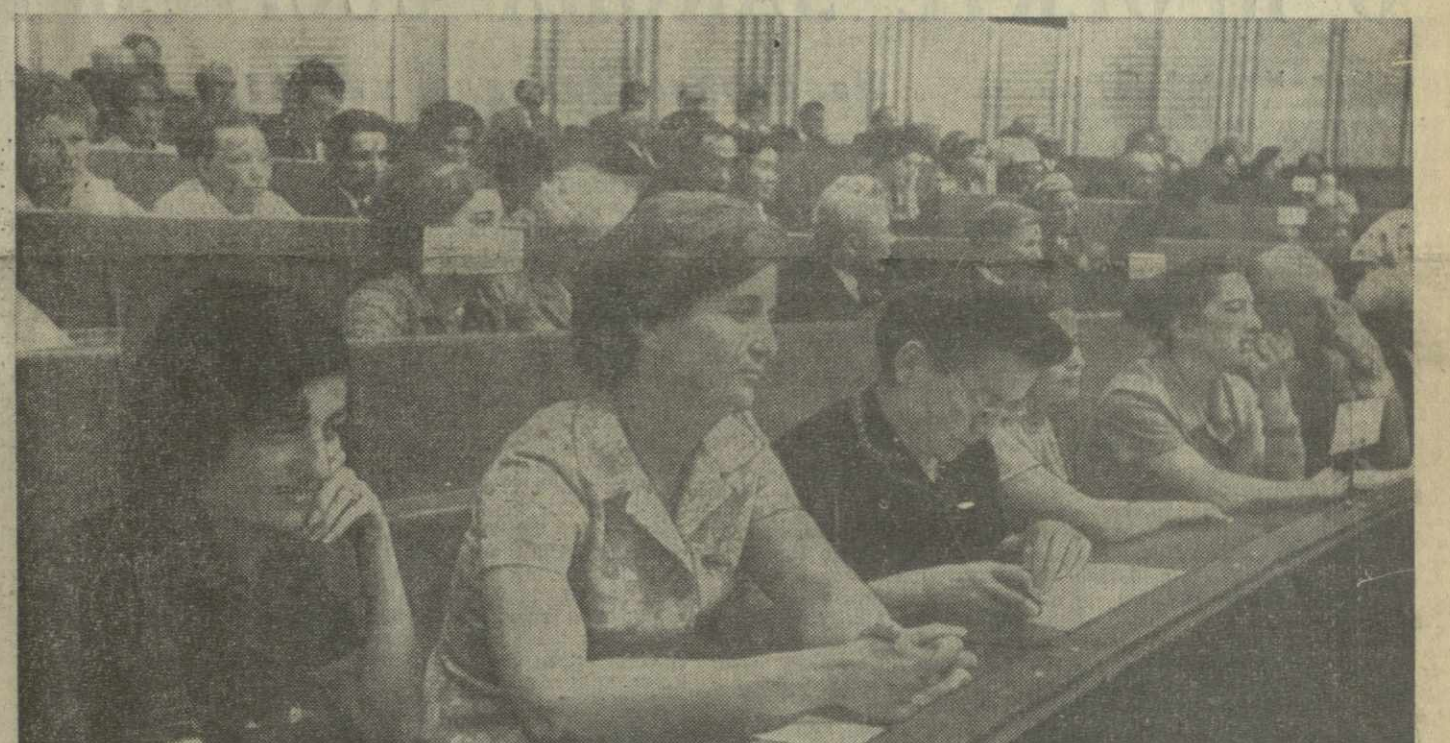
Москва. В зале заседаний палат в Кремле. На снимке: депутаты от Абхазской АССР во время заседания.