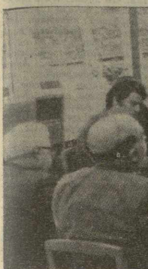
Во время встречи.