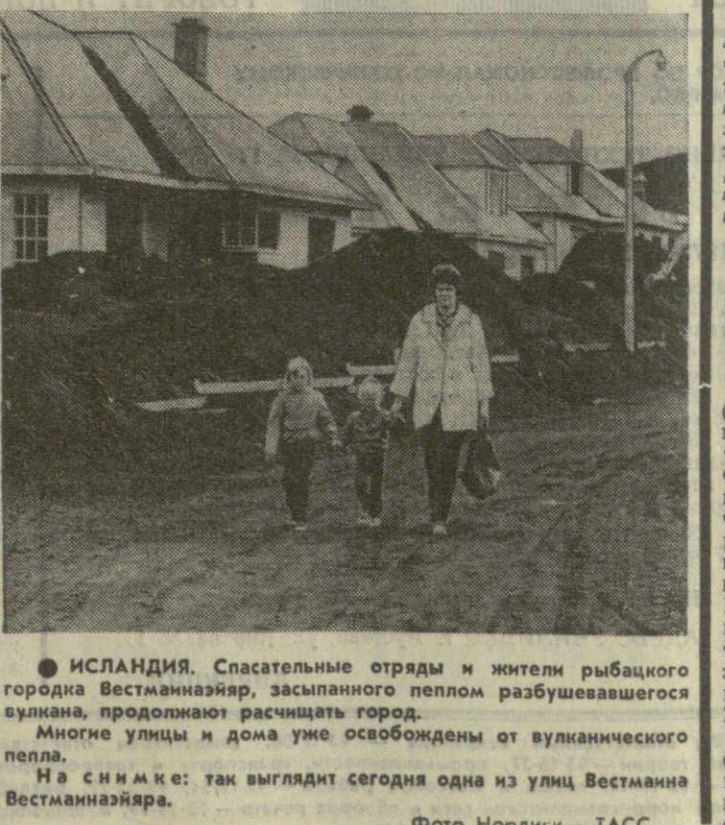
Исландия. Спасательные отряды и жители рыбацкого городка Вестманнаэйри, заспанного пеплом разбушевавшегося вулкана, продолжают расчищать город.

1 августа 1973 года в Советском Союзе произведен запуск очередного искусственного спутника Земли «Космос-578». Установленная на спутнике аппаратура работает нормально. Координационно-вычислительный центр ведет обработку поступающей информации. (ТАСС).