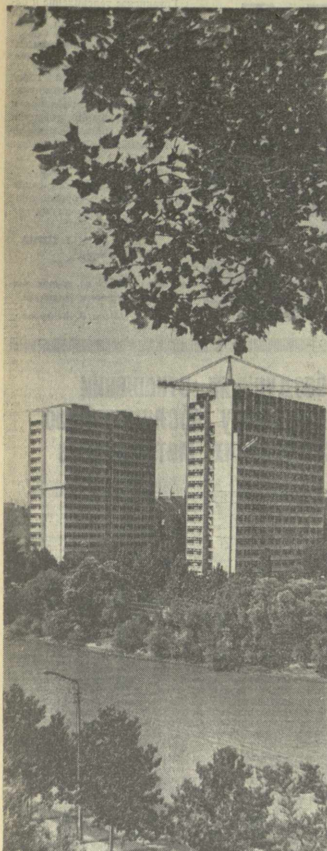
В ЭТОМ ГОДУ десятки работников кинематографии Грузии отразили новеллы в высочайших кооперативных зданиях, которые строятся на левом берегу Куры. На снимке: новые жилые многоквартирные дома для работников кинематографии.

НЬЮ-Йорк, 3 августа. (ТАСС). Я еще никогда не встречал такого энтузиазма среди американских спортсменов — студентов, — сказал корреспонденту ТАСС исполняющий директор академического спортивного общества США Франк Вао о подготовке американской команды ко Всемирной универсиаде в Москве. Впервые в истории студенческих игр США направил на соревнования полную спортивную делегацию — 303 человека, которые примут участие в соревнованиях по всем видам спорта, входящим в программу. Подготовка к московским стартам ведется в стране как к крупнейшему спортивному событию нынешнего года.