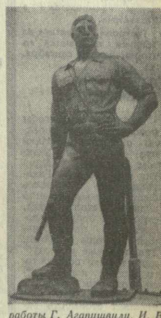
работы Г. Гапишвили, И. Вепхадзе, О. Кочкашвили и др.