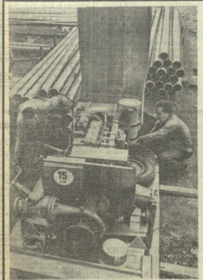
● СССР. Производство машиностроительного завода «Сигма» в городе Оломоуц — различного вида насосные установки — известны более чем в тридцати странах. Наиболее крупный из зарубежных заказчиков — Советский Союз. Сейчас коллективы «Сигмы» в сотрудничестве с польскими машиностроителями приступили к выпуску насосных станций, предназначенных для орошения. На снимке: подготовка насосной станции к отправке в СССР.