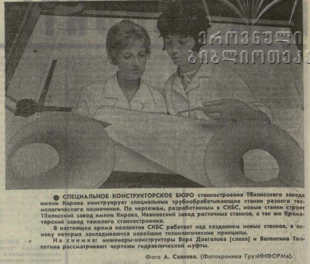
СПЕЦИАЛЬНОЕ КОНСТРУКТОРСКОЕ БЮРО станкостроения Тбилисского завода имени Кирова конструирует специальные трубообрабатывающие станки различного технологического назначения.

В Сочи закончился Кубок СССР по баскетболу. Финал состоялся накануне в субботу. Победу одержали баскетболисты ЦСКА.