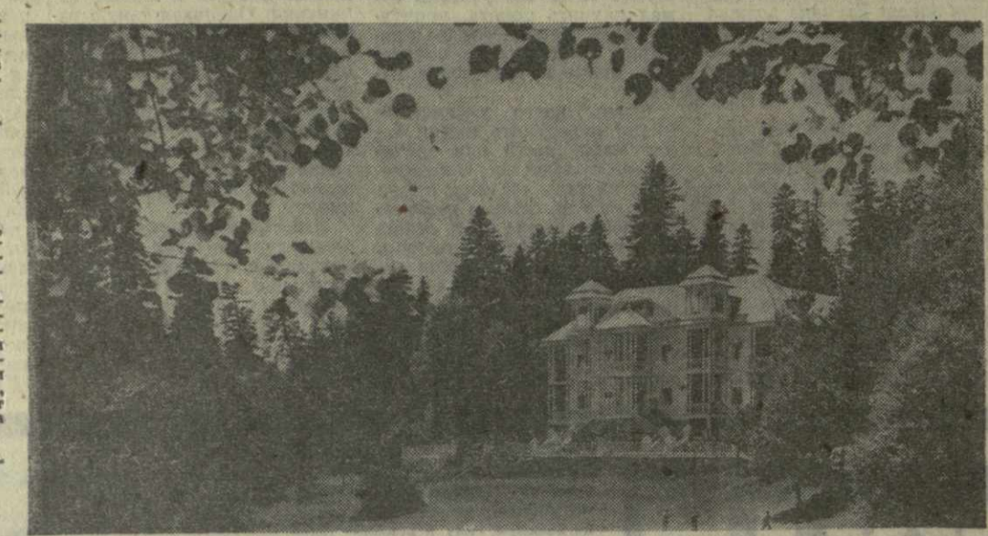
На снимке: один из уголков курорта Шови.

В ГОРАХ ОНКОЛО РАЙОНА, на высоте 1600 метров над уровнем моря, где берет начало знаменитый Риопи, расположен знаменитый курорт Шови. Этот горноклиматический курорт славится тем, что он находится в живописном уголке, в окружении заснеженных гор и хвойных лесов. Наличие множества источников, в том числе и минеральных, чистый воздух, привлекательная природа делают Шови популярным местом отдыха в туризме.