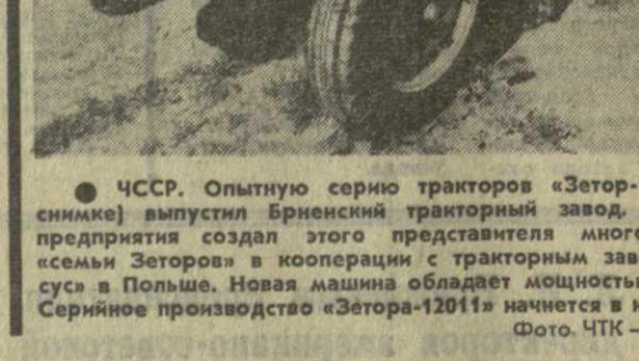
● ЧССР. Опытную серию тракторов «Зетор-1201» (на снимке) выпустил Брненский тракторный завод. Коллектив предприятия создал этого представителя многочисленной «семьи Зеторов» в кооперации с тракторным заводом «Урсус» в Польше. Новая машина обладает мощностью 120 л.с. Серийное производство «Зетора-1201» начнется в конце года.

САНТЬЯГО, 28 августа. (ТАСС). В Чили сохраняется напряженная обстановка в связи с непрекращающимися антиправительственными выступлениями реакционных сил. Вновь объявила 24-часовую забастовку конфедерация торговцев и мелких промышленников. Забастовка торговцев носит откровенно политический характер. Крайне реакционные лидеры объединения владельцев грузовиков тем временем продолжают затягивать урегулирование конфликта и прекращение забастовки, длящейся уже больше месяца. По сообщению радио, арестованный службой расследования главарь фашистской группировки «Патрия и либертад» Роберто Тим признал на допросе, что его организация координировала свои действия с лидером владельцев грузовиков Леонам Вильярином и что забастовка транспортников организована с целью свержения правительства.