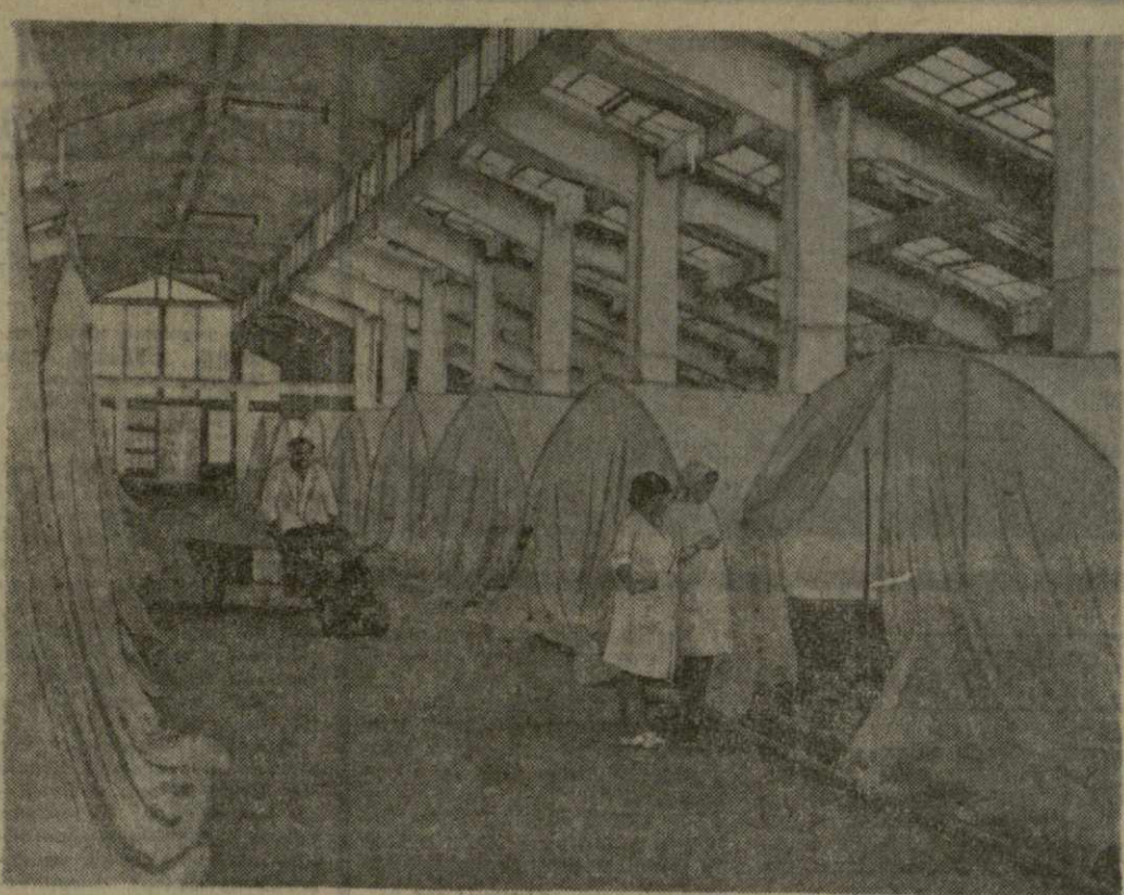
«АНАСЕУЛИ-1» — так называемый чай клон-257, выведенный на плантациях Всесоюзного научно-исследовательского института чая и субтропических культур. Он отличается высокой урожайностью, морозостойкостью, крупноплодностью. В институте разработан прогрессивный способ вегетативного размножения чая в камерах искусственного тумана, где необходимые параметры микроклимата поддерживаются автоматом. Институту передано опытных плантаций 200 тысяч саженцев чая клон-257 с тем, чтобы уже в будущем году получить полтора миллиона саженцев для посадки промышленных плантаций.