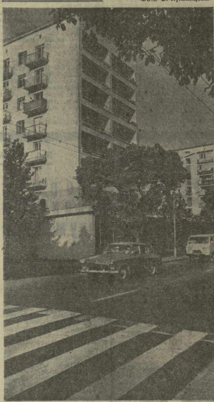
ПО ЗАКОНАМ МУЖЕСТВА