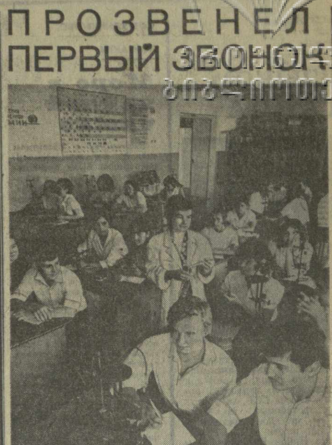
Привычная трель школьного звонка отзвонела. Идет урок, первый в новом учебном году. На снимке: урок химии в 148-й тбилисской средней школе, расположенной на территории поселка ТЭВЗ.