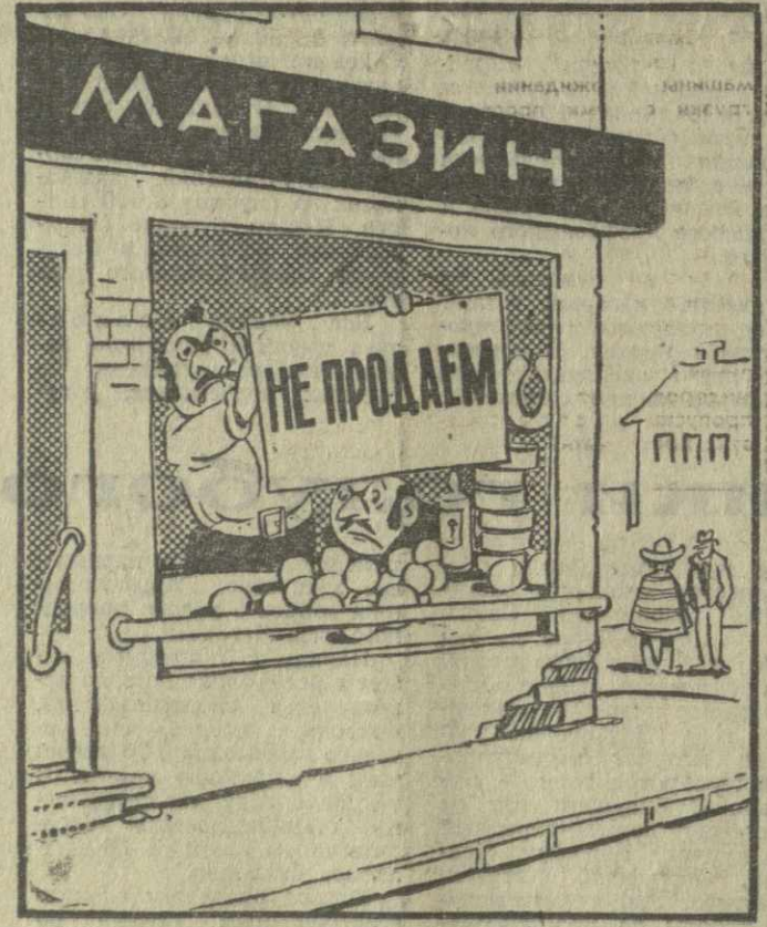
Так продаются завоевания народа. Рис. А. Кандеяки.