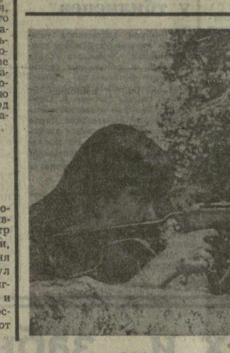
Силы освобождения Камбоджи продолжают наступательные операции на всех участках боевых действий в стране.

Высший комитет принял также решение продолжать контакты с прогрессивными национальными элементами в целях привлечения их к участию в различных областях его деятельности.