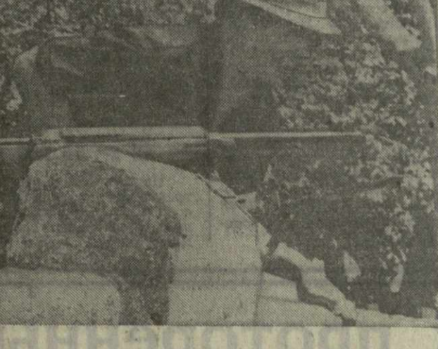
Силы освобождения Камбоджи продолжают наступательные операции на всех участках боевых действий в стране.

Результаты X съезда Коммунистической партии Китая свидетельствуют о том, подчеркивает орган ЦК СЕИП, что необходимо еще шире разрабатывать политические и теоретические подлинную сущность маонизма, чтобы все прогрессивные силы, партии и организации осознали реакционный характер политики Пекина и активно выступили против нее.