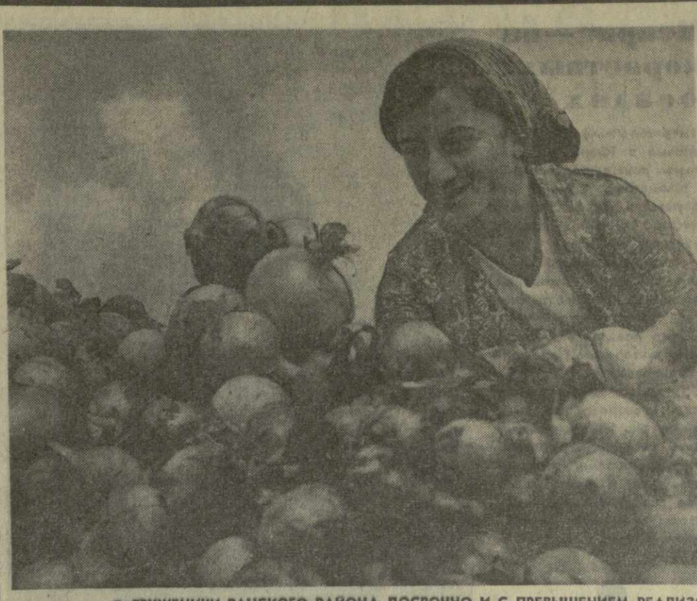
ТРУЖЕНИКИ ВАНСКОГО РАЙОНА ДОСРОЧНО И С ПРЕВЫШЕНИЕМ РЕАЛИЗОВАЛИ ЗАДАНИЕ ПО ЗАГОТОВКЕ ОВОЩЕЙ. Собирают урожай лука сорта «ванури». Вместо плановых 1.900 тонн уже продано государству 3 тысячи тонн лука. Порадовали обильными урожаями овощей колхозники сел Шуамта, Тобаниери, Мукеди, Цихесулори и других.