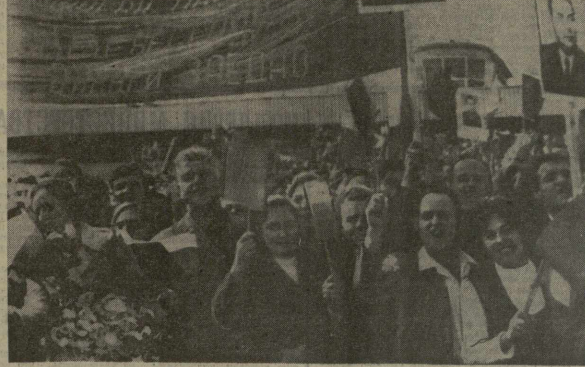
София. На снимках: во время проводов на аэродроме в Софии.