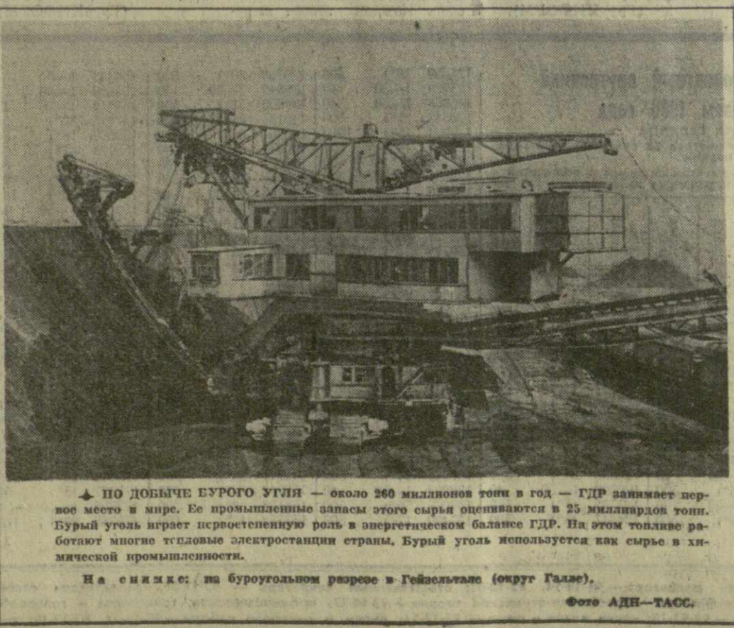
По добыче бурого угля — около 260 миллионов тонн в год — ГДР занимает первое место в мире. Ее промышленные запасы этого сырья оцениваются в 25 миллиардов тонн. Бурый уголь играет первостепенную роль в энергетическом балансе ГДР. На этом топливе работают многие крупные электростанции страны. Бурый уголь используется как сырье в химической промышленности.

В. ГОРДОНОВ, И. ХУТОРНЫЙ, (Соб. корр. АПН).