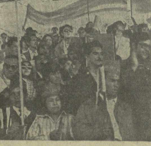
Под лозунгом «С народом Чили против сил реакции и империализма» состоялся многолюдный митинг в колумбийской столице. Участники митинга осудили кампанию террора, развязанную чилийской военщиной, и заявили о своей солидарности с чилийским народом. На сцене: на митинге в Боготе.

Участники митинга осудили кампанию террора, развязанную чилийской военщиной, и заявили о своей солидарности с чилийским народом. На сцене: на митинге в Боготе.