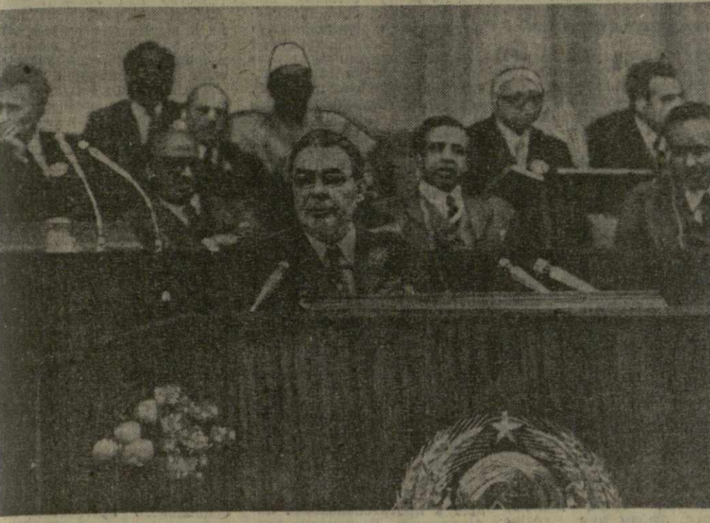
26 октября в столице Советского Союза Москва продолжал свою работу Всемирный конгресс миролюбивых сил.

На вечернем заседании с речью выступил Генеральный секретарь ЦК КПСС товарищ Л. И. Брежнев.