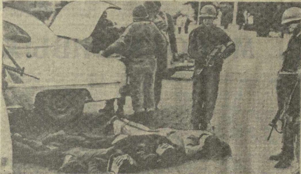
Чилийская военная хунта, пытаясь подавить сопротивление патристических сил и укрепить установленный ею режим, не прекращает кровавые репрессии. Каждый день каратели уничтожают или заточают в тюрьмы многие десятки сторонников свергнутого правительства Народного единства. Проводятся массовые облавы и аресты. На снимке: во время облавы на улицах Сантьяго.

женены все левые организации». В список левых чилийских «горилла» занесены не только прогрессивные политические партии и группировки. Единый профинансированный Чили, но и все организации, на которые падает хоть какое-то подозрение в соприкосновении нынешнему режиму. В официальном коммюнике военных правителей говорится, что смертный приговор этим лицам был вынесен «с целью очистить страну от марксистских элементов». В этом же коммюнике указывается, что расстрелы будут производиться в апрель. Хунта подтвердила, что на всей территории страны сохраняется комендантский час и так называемое «состояние внутренней войны», которые будут действовать до тех пор, «пока не будут уни-