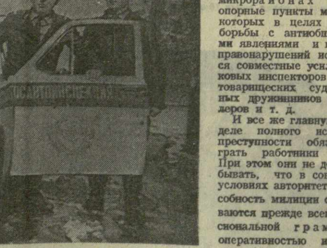
7 ноября. (ТАСС).

Улучшилась система управления, последовательно внедряется специализация, приняты меры по повышению оперативности, эффективности использования сил и средств. На качественно новый уровень поднялась дея-