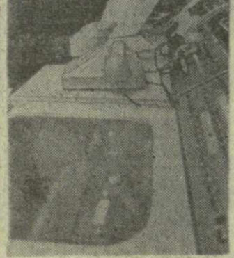
7 ноября. (ТАСС).

В послевоенные годы действия милиции направлялись на дальнейшее укрепление общественного порядка, уси-