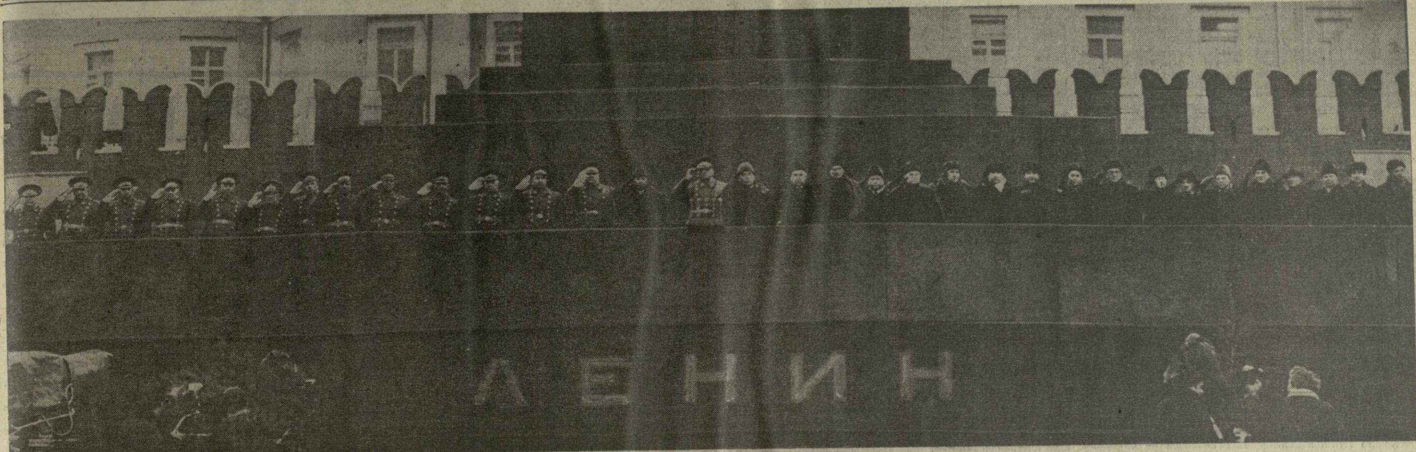
Москва, 7 ноября 1973 года. Красная площадь. Празднование 56-й годовщины Великой Октябрьской социалистической революции. На снимке: на трибуне Мавзолея В. И. Ленина.

Праздничные торжества вновь продемонстрировали великое нерушимое единство партии и народа, твердую волю советских людей с честью выполнить исторические решения XXIV съезда КПСС.