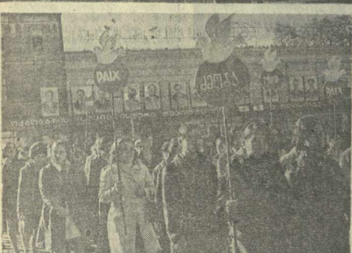
7 НОЯБРЯ 1973 ГОДА. На снимках (сверху вниз): в праздничных колоннах представители трудящихся в Сухуми, Батуми и Кутаиси.