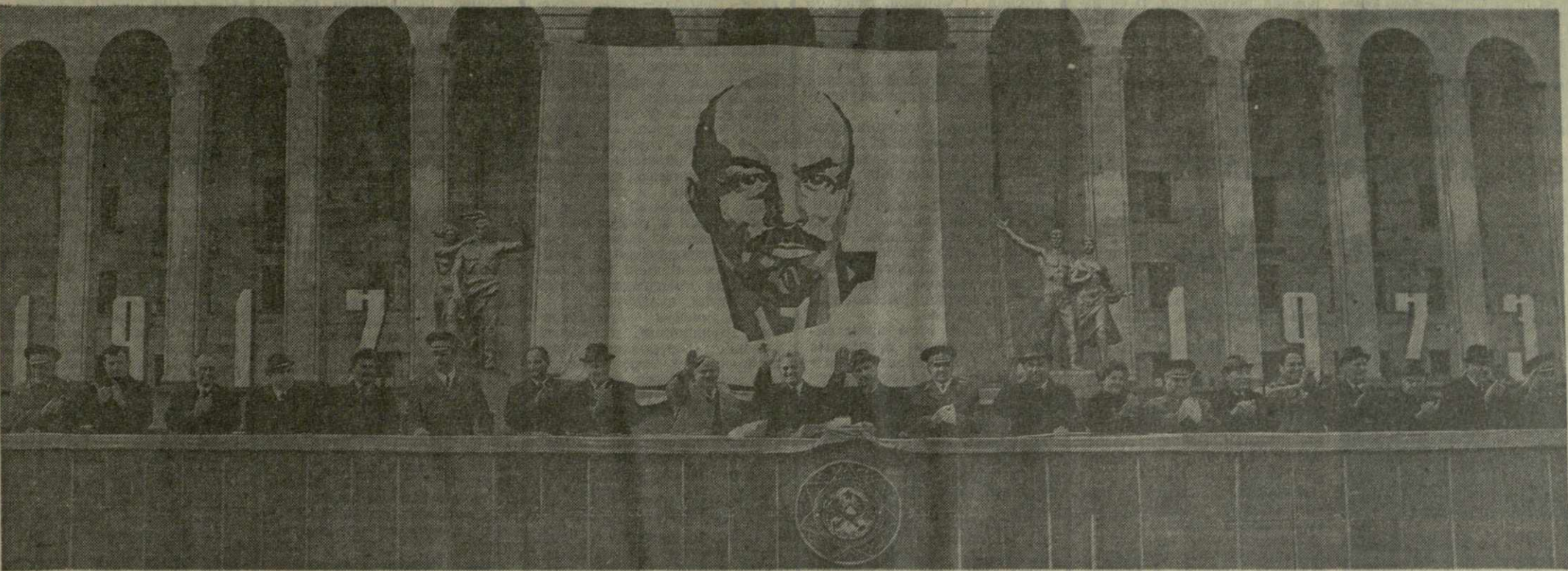
Тбилиси, 7 ноября 1973 года. Празднование 56-й годовщины Великой Октябрьской социалистической революции. На центральной трибуне на проспекте Руставели.

10 часов утра. Со стороны площади Ленина выезжает на открытой машине коман-