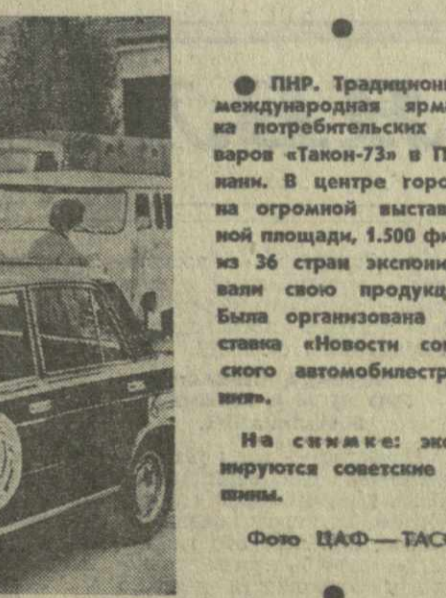
На снимке: экспонируются советские машины.