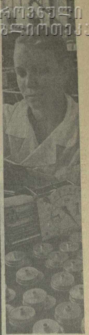
12 ЛЕТ РАБОТАЕТ слесарем-сборщиком Р. Деревенская (на снимке) на заводе «Тбилиблор». Собирая тонкие приборы-скоростомеры для локомотивов, она регулярно выполняет задания на 150-160 процентов.