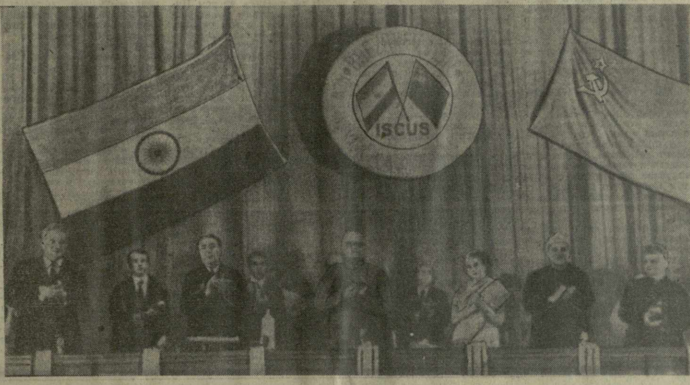
ДЕЛИ, 28 ноября в зале Дворца науки состоялась встреча Генерального секретаря ЦК КПСС Л. И. Брежнева с активом Индийско-советского культурного общества (ИСКО). На снимке: в президиуме во время встречи.