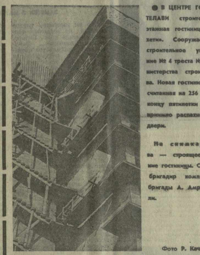
В ЦЕНТРЕ ГОРОДА ТЕЛАВИ строится 13-этажная гостиница «Колхид». Сооружает ее строительное управление № 4 треста № 2 Министерства строительства. Новая гостиница, рассчитанная на 256 мест, к концу пятилетия гостеприимно распахнет свои двери.