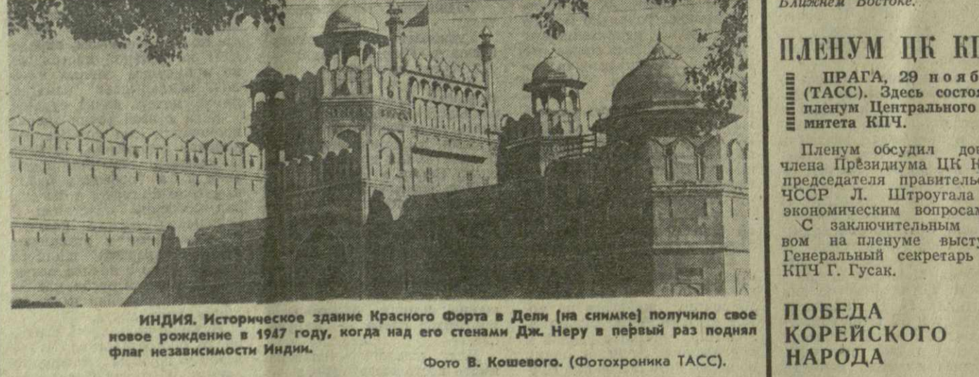
ИНДИЯ. Историческое здание Красного Форта в Дели (на снимке) получило свое новое рождение в 1947 году, когда над его стенами Дж. Неру в первый раз поднял флаг независимости Индии.