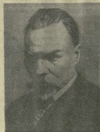
К 100-ЛЕТИЮ СО ДНЯ РОЖДЕНИЯ В. Я. БРЮСОВА