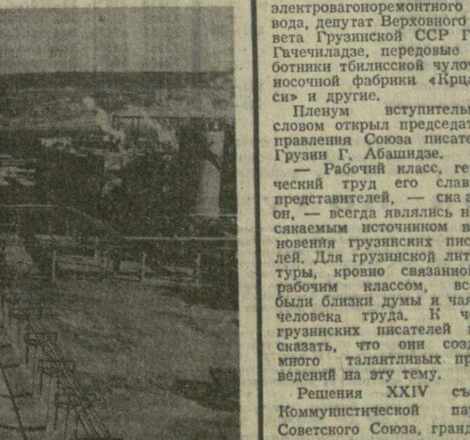
В АЙКЕ, ПРОМЫШЛЕННОМ ЦЕНТРЕ на западе Венгерской Народной Республики, введен в эксплуатацию гномоземный завод (на снимке). Новое крупное предприятие, оснащенное современным оборудованием, будет давать ежегодно 240 тысяч тонн продукции, перерабатывая сырье с близлежащих бокситовых шахт.

СОФИЯ, 26 декабря. (ТАСС). В столице Болгарии началось строительство технического центра Союза болгарских автомобилистов. Он будет представлять собой крупнейший в стране комплекс по ремонту и обслуживанию автомобилей. Здесь же будет работать школа по подготовке шоферов-любителей и кадров для автомобильного транспорта Болгарии. Первую очередь технического центра намерено сдать в эксплуатацию в 1974 году.