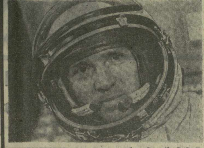
Борт-инженер космического корабля «Союз-13» В. В. Лебедев.