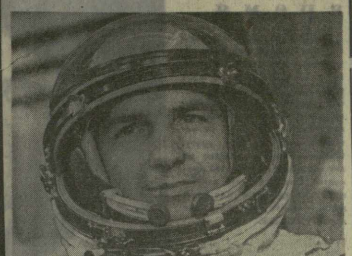
Командир космического корабля «Союз-13» П. И. Климук.