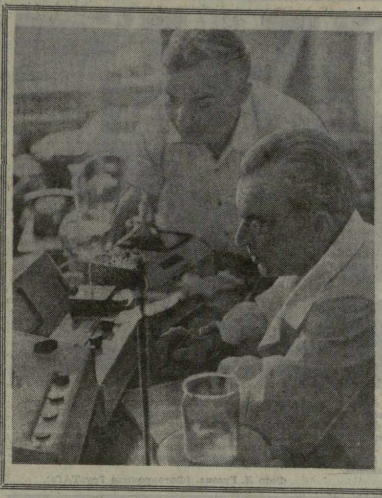
Новый аналитический прибор — агрегатированный комплекс лабораторного титровального оборудования «Т-101» разработан и создан в отделе оптических анализом Тбилисского государственного конструкторского бюро аналитического приборостроения.

Проверенные на предприятиях и в торговой сети подделывались проиловства Гадского райкомбината имени Гробице соединительные