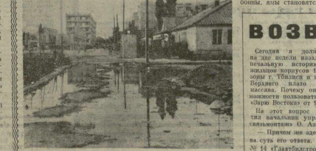
На снимке: улица Даднани в Кутанси.