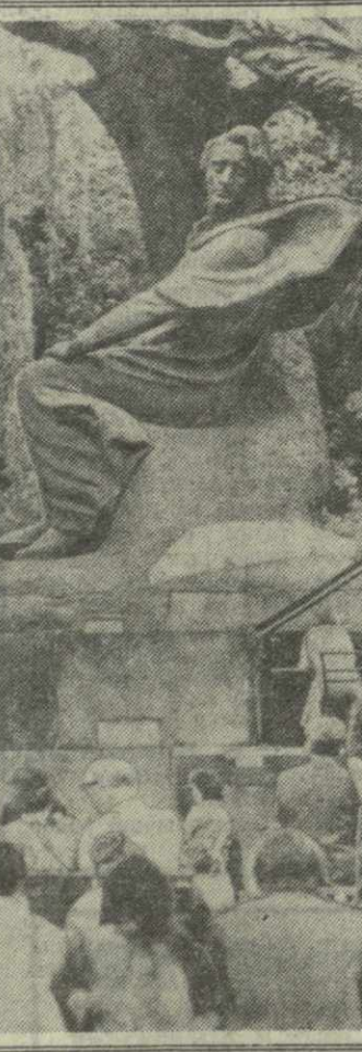
ИНР. В знаменитом варшавском парке Лазенки, начиная с мая месяца и до самой глубокой осени, каждое воскресенье в течение часа звучат беспрерывные творения Шопена. Эти концерты проходят всегда при большом стечении людей, и даже, когда идет дождь, варшавяне и гости столицы приходят послушать любимые мелодии в исполнении лучших музыкантов Польши.

ЛИМА, 27 августа. (ТАСС). Бывший президент Боливии генерал Хуан Хосе Торрес, свергнутый в результате военного переворота, прибыл в перуанскую столицу.