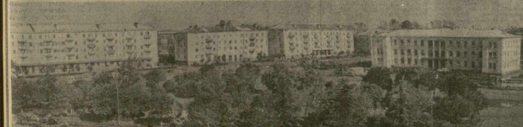
Поти — один из крупнейших городов на берегу Черного моря. За последние годы здесь построены новые многоквартирные жилые дома, школы, детские ясли, кинотеатр, комбинаты бытового обслуживания, административные здания и много других сооружений.