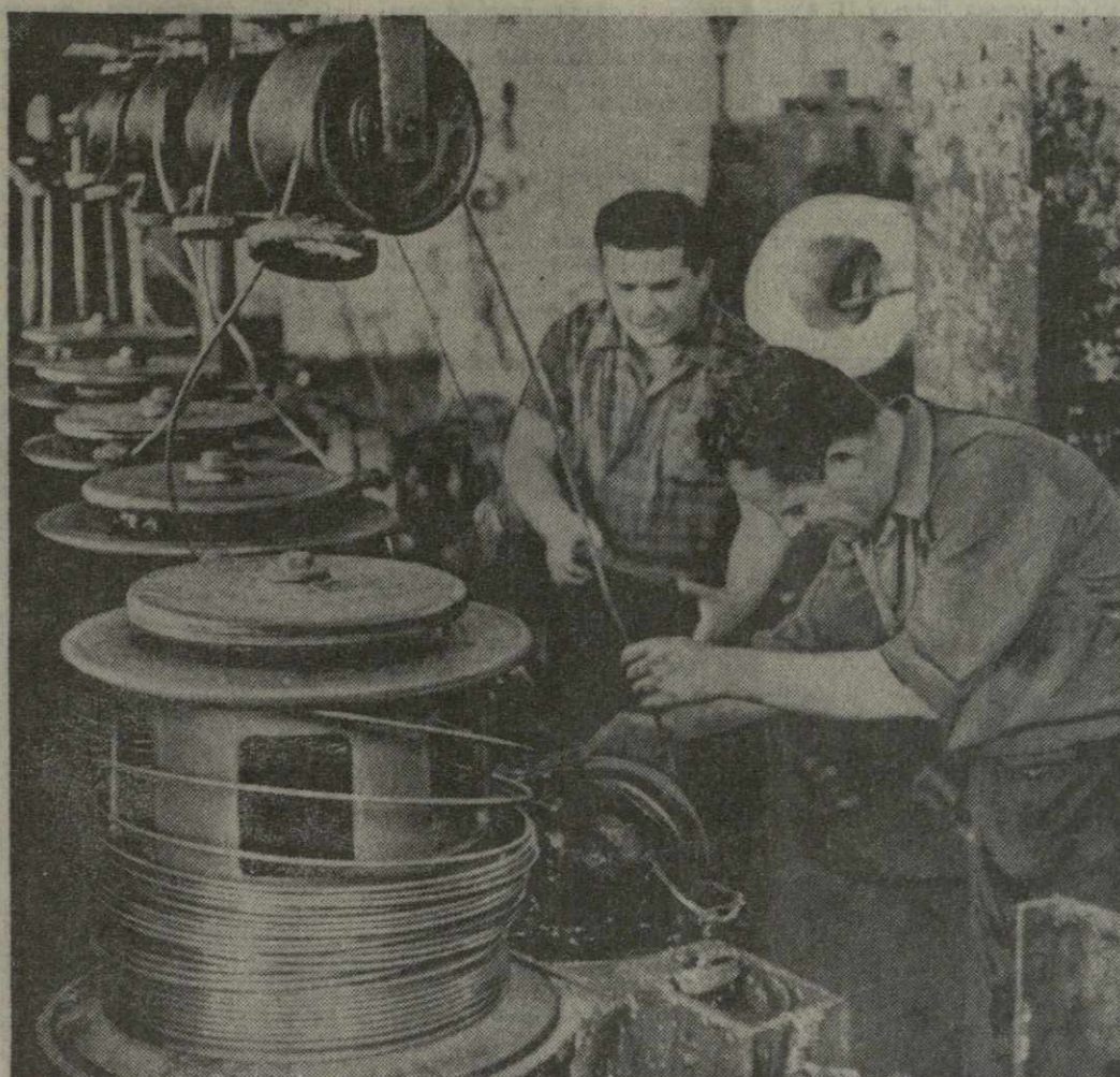
С КАЖДЫМ днем ширится в республике предоктябрьское социалистическое соревнование. Труженики промышленных предприятий, пересмотрев свои возможности, берут на себя новые, повышенные обязательства.

Между А. Н. Косыгиным и Г. Вильсоном состоялась дружественная беседа по ряду актуальных международных проблем и вопросам советско-английских отношений. В тот же день А. Н. Косыгин устроил завтрак в честь Г. Вильсона. (ТАСС.)