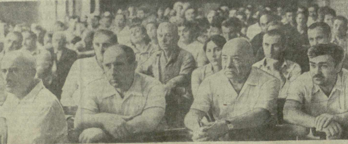
Внимательно слушают выступления своих товарищей по труду коммунисты завода. Идет большой принципиальный разговор о чести заводской марки.

Большой и принципиальный разговор о резервах производства, путях дальнейшего улучшения качества продукции, совершенствовании форм социалистического соревнования повели коммунисты «Центролита». Он помог и четко определить свои первоочередные задачи в борьбе за успешное выполнение планов новой пятилетки.