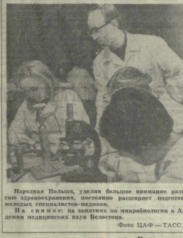
Народная Польша, уделяя большое внимание развитию здравоохранения, постоянно расширяет подготовку молодых специалистов-медиков. На снимке: на занятиях по микробиологии в Академии медицинских наук Белостока.

ЛОНДОН, 21 сентября. (ТАСС). Американская авиация совершила сегодня массированный бомбовый налет на районы Демократической Республики Вьетнам, прилегающие к демилитаризованной зоне. Как и раньше, командование США оправдывало эти варварские бомбардировки необходимостью защиты американских самолетов, ведущих разведку над территорией ДРВ. По сообщению агентства Рейтер, в сегодняшней бомбардировке участвовало несколько десятков сверхзвуковых истребителей-бомбардировщиков США.