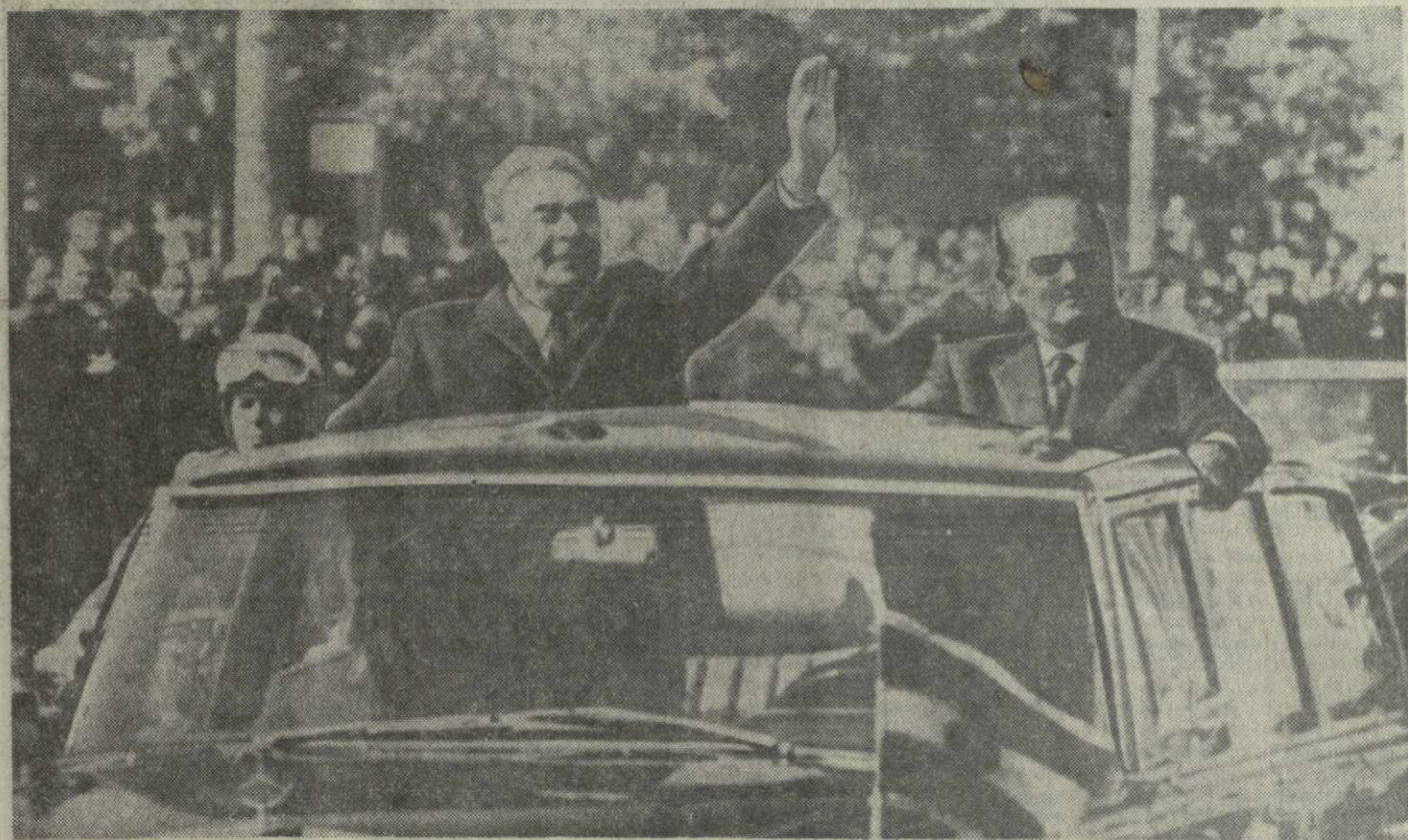
На снимке: Л. И. Брежнев и Иосип Броз Тито отвечают на приветствия белградцев.

Эта наша встреча также даст нам возможность обменяться мнениями и по актуальным международным вопросам, которые обременя-