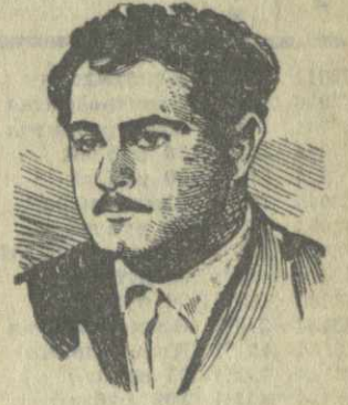
являл инициативу и мастерство.

Особое внимание уделялось организации соревнования внутри отдельных подразделений — бригад и звеньев. В нашей бригаде, например, люди имели четкую программу работ, выполнение которой требовало больших усилий. Но вместе с тем эта программа материально щедро поощряла каждого, кто про-