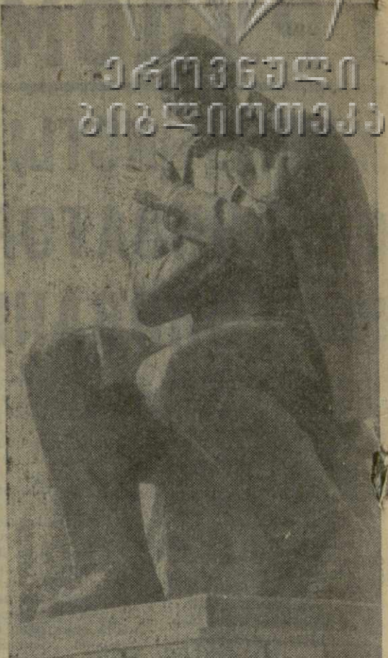
На снимке: памятник З. Палиашвили в Боржоме.

Перед взорами собравшихся предстает скульптурное изображение Захария Палиашвили работы заслуженного художника Грузии Т. Гвишиани.