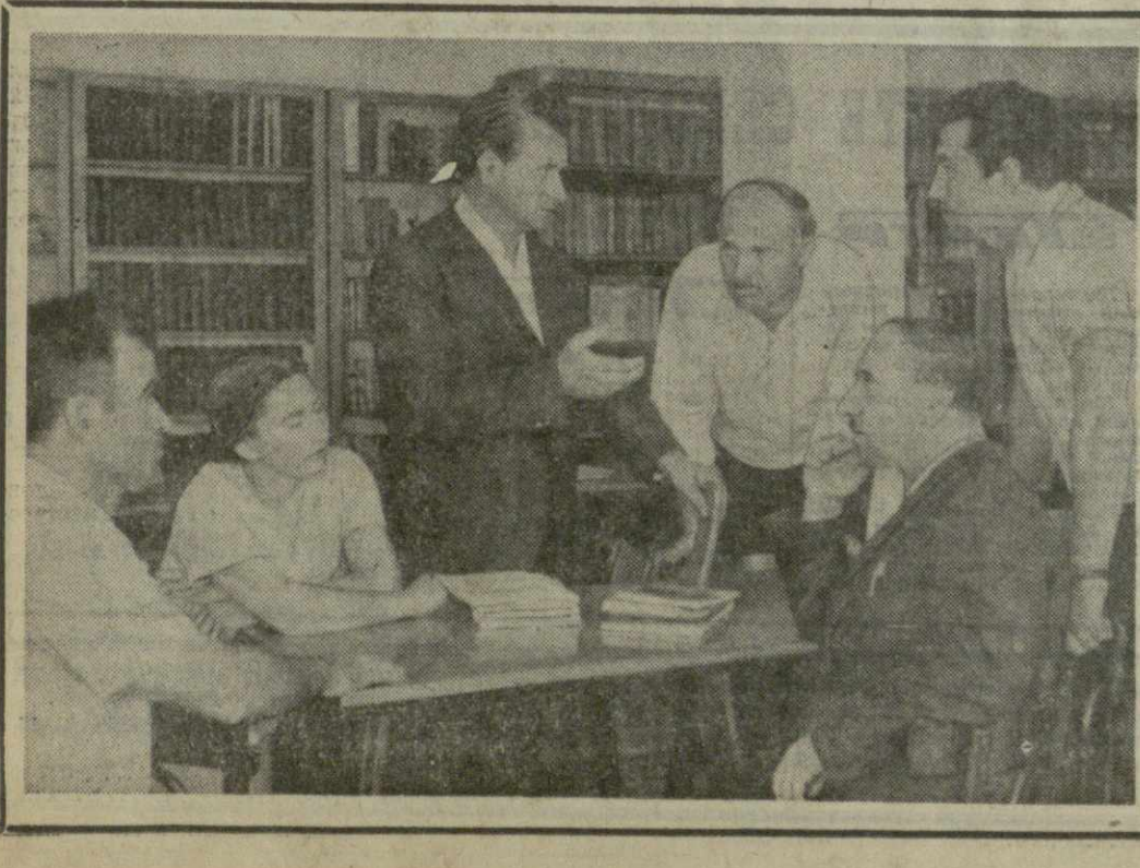
Скоро начнется новый учебный год в сети партийного образования. Хорошо подготовились к нему в Ванском партийной организации. Здесь своевременно были укомплектованы школы по изучению марксизма-ленинизма, истории Коммунистической партии Грузии, начальные политшколы, теоретические семинары.

тегория людей, так называемых «летунов». В погоне за длинным рублем они довольно легко переходят с одного места на другое. Кадровые же специалисты, проработавшие на заводе до трех лет и более, увольняются значительно реже. Благодаря проведенному исследованию администрация завода наметила и провела ряд эффективных мер по закреплению кадров на предприятии. К осуществлению мероприятий по сокращению текучести рабочей силы были привлечены не только работники административно-управленческого персонала, но и общественные, партийные, профсоюзные и комсомольские организации завода, агитаторы, пропагандисты, низовая печать. В октябре на заводе будет создан общественный отдел кадров и зарплаты, а в цехах — общественные комиссии по закреплению кадров. По опыту других родственных заводов страны они будут не только вести широкую разъяснительную и воспитательную работу, но и добиваться от администрации максимального удовлетворения нужд и запросов трудящихся, способствовать ликвидации причин, вызывающих текучесть рабочей силы. Конечно, это только первый шаг в нашей борьбе за закрепление кадров. Коллектив завода думает провести еще ряд мероприятий, которые помогут нам сократить текучесть рабочей силы. В. РУХАДЗЕ, заместитель начальника отдела научной организации труда Зестафонского ферросплавного завода, заслуженный инженер Грузинской ССР.