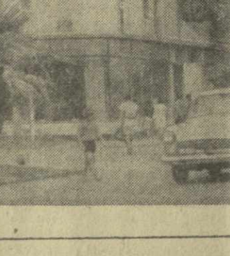
На снимке: один из новых районов Батуми.

Батуми растет не только шире, но и выше. За последние годы город украсили новые многоэтажные здания. Сейчас разрабатывают генеральный план застройки столицы Абхазии. В плане — строительство новых многоэтажных жилых домов, гостиниц, предприятий и служб быта.