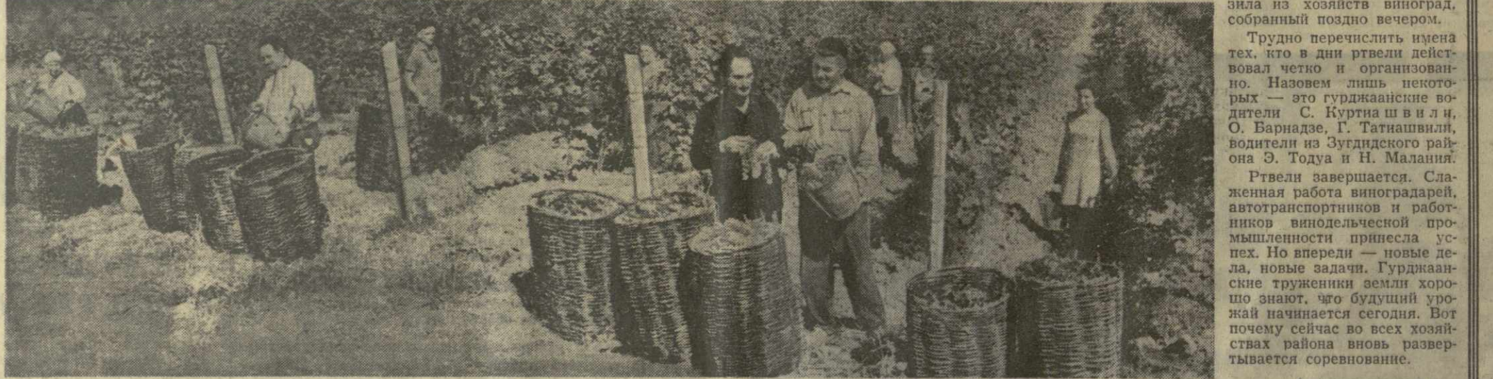
В колхозе села Велицкие Гурджанского района убирают последние тонны винограда. Хозяйство уже заготовило 4.600 тонн винограда...