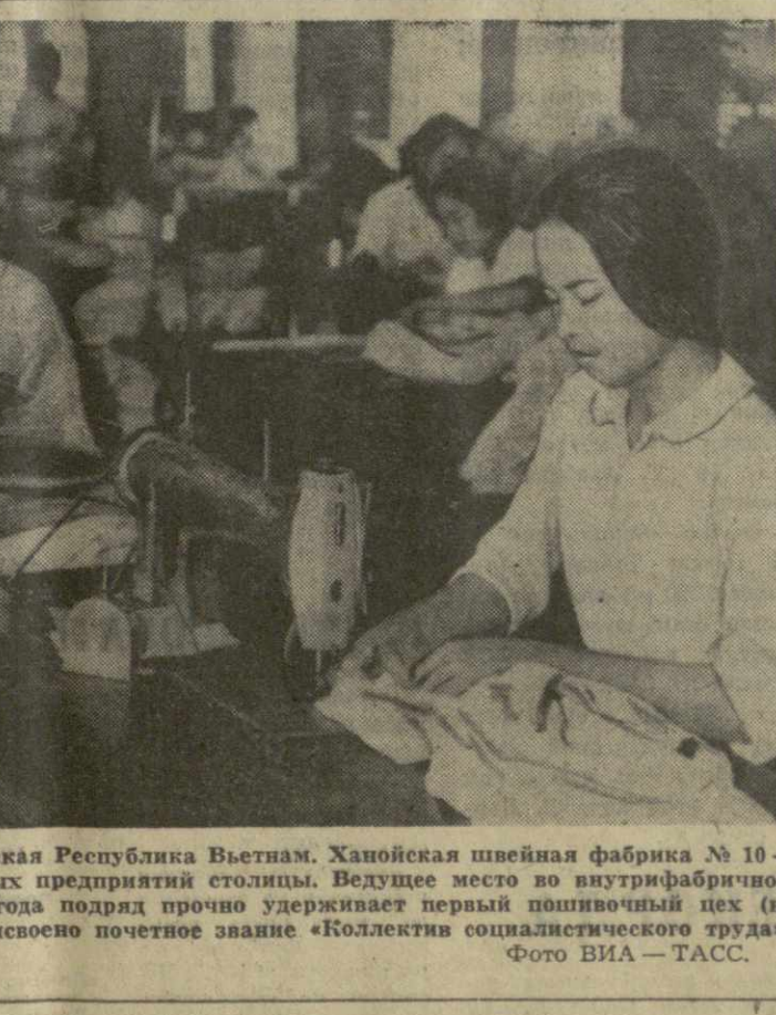
Демократическая Республика Вьетнам. Ханойская швейная фабрика № 10 — одно из передовых предприятий столицы. Ведущее место во внутрифирменном соревновании 4 года подряд прочно удерживает первый пошивочный цех (на снимке). Ему присвоено почетное звание «Коллектив социалистического труда».