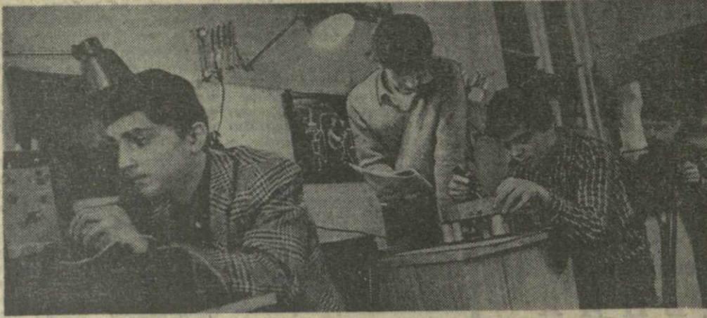
В многочисленных кружках и кабинетах республиканского Дворца пионеров и школьников им. Дзедзепала занимаются до 10 тысяч мальчиков и девочек.