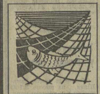
ТОМ, КАКОЙ ущерб приносит богатству внутренних водоемов республики рост объема сточных вод и нерационально ведущийся рыбный промысел, писали достаточно много. И хотя мы, икhtiологи, а также работники рыбного хозяйства, пока не видим, чтобы в ответ были приняты энергичные меры по предотвращению чумы истребления рыбы, хочется указать еще на одну опасность, возникшую перед речной фауной.

докладами «Верховный суд — высший орган правосудия». «Ответственность за воинские преступления», «Закон о браке и семье». Юристы ответили на ряд вопросов военнослужащих. В торжественной обстановке был зачитан приказ о награждении передовых воинов, отличившихся на службе, ценными подарками. Здесь же пятнадцати отличившимся воинам были вручены подарки (ГрузИНФОРМ).