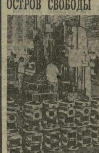
А. в городе сьенбуэгоос на Кубе сооружен крупный машиностроительный завод. Он выпускает ежегодно для сельского хозяйства 1.800 дизель-моторов и 1.500 комбайнов.