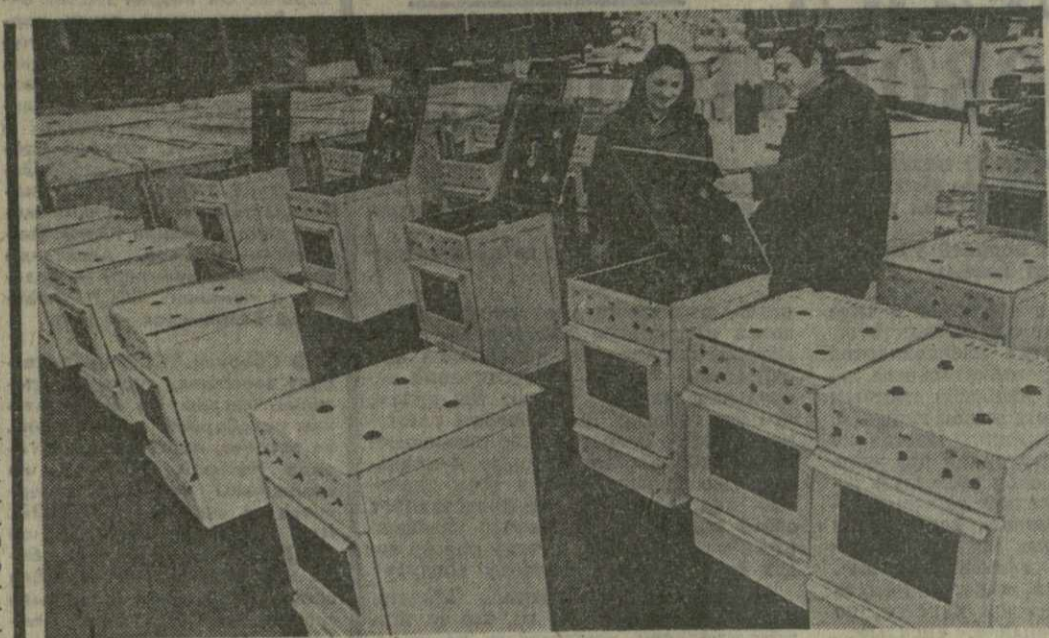
ПРОДУКЦИЯ ТБИЛИССКОГО ЗАВОДА «ГАЗОАППАРАТ» пользуется большим успехом не только среди населения Грузии, но и многих городов Советского Союза. Сейчас на заводе развернуто социалистическое соревнование за досрочное выполнение плана четвертого года пятилетия.