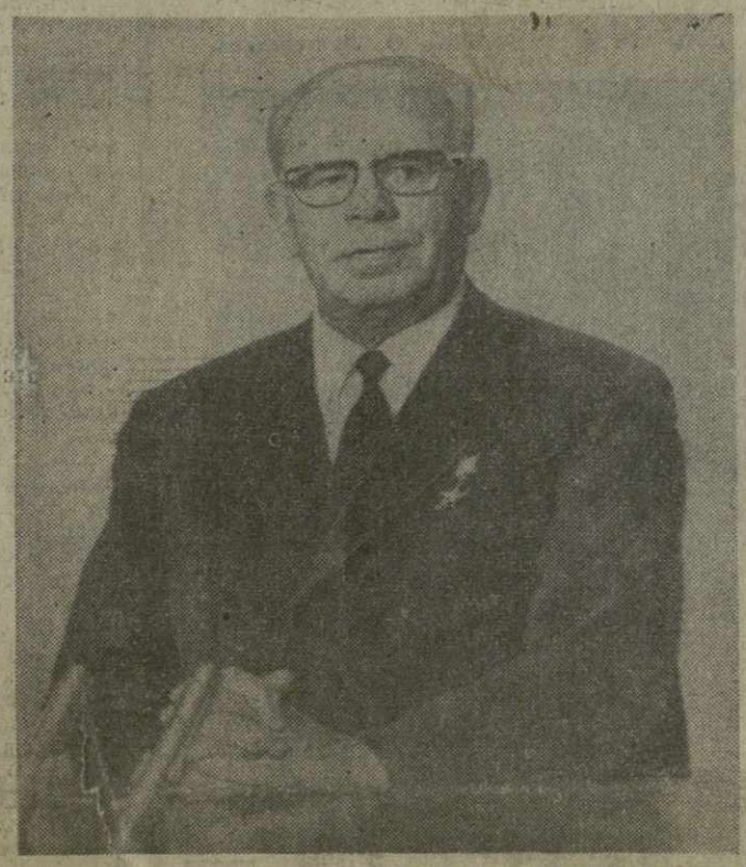
Председатель Президиума Верховного Совета СССР Н. В. Подгорный.