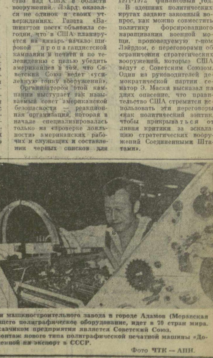
СССР. Продукция машиностроительного завода в городе Ламов (Моравская область), изготовленного подгравированное оборудование, идет в 70 стран мира. Самым крупным заказчиком предприятия является Советский Союз. На снимке: монтаж нового типа полиграфической печатной машины «Доминант», предназначенной для экспорта в СССР.

ХАНОЙ. 30 декабря. (ТАСС). По сообщению ханойского радио, в течение сегодняшнего дня защитники ДРВ отразили налеты американской авиации, сбив 8 самолетов. Два американских пилота захвачены в плен. Таким образом, с 26 по 30 декабря США потеряли в небе ДРВ 19 самолетов. Общее число американских самолетов, сбитых над территорией Северного Вьетнама, достигло 3.427.