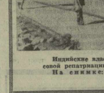
Индийские власти приступили к выполнению намеченной программы массовой репатриации восточнобенгальских беженцев. На снимке: беженцы возвращаются в город Дакку.

НЬЮ-Йорк, 11 января. (ТАСС). Четыре человека убиты и несколько человек тяжело ранено — таков итог очередной полицейской расправы над участниками демонстрации протеста против расизма и социальной несправедливости, состоявшейся в Батон Руж (штат Луизиана). Сотни учащихся негритянских школ вышли на одну из улиц города с лозунгами: «Мы требуем справедливости». «Прекратите полицейские репрессии». «Остановите расовые войны». «Мы хотим жить в человеческих условиях». На их «усмирение» власти бросили отряды полицейских и национальных гвардейцев, которые набросились на демонстрантов, затем открыли огонь. Кровавая расправа с демонстрантами вызвала гнев среди жителей Батон Руж — во многих частях города вспыхнули негритянские волнения. Как сообщают из Батон Руж, в городе объявлено чрезвычайное положение.