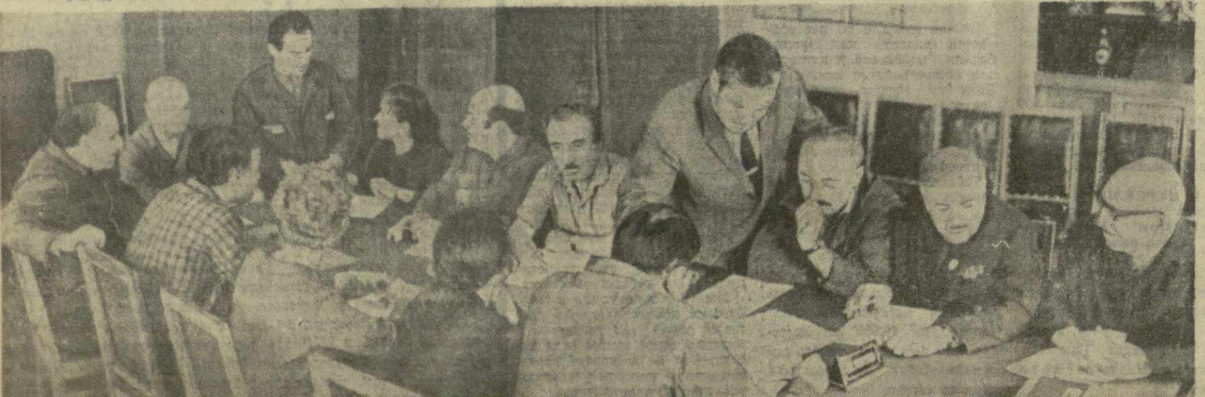
На снимке: идет производственное совещание. Руководители всех служб предприятия обсуждают возможности досрочного выполнения взятых обязательств.