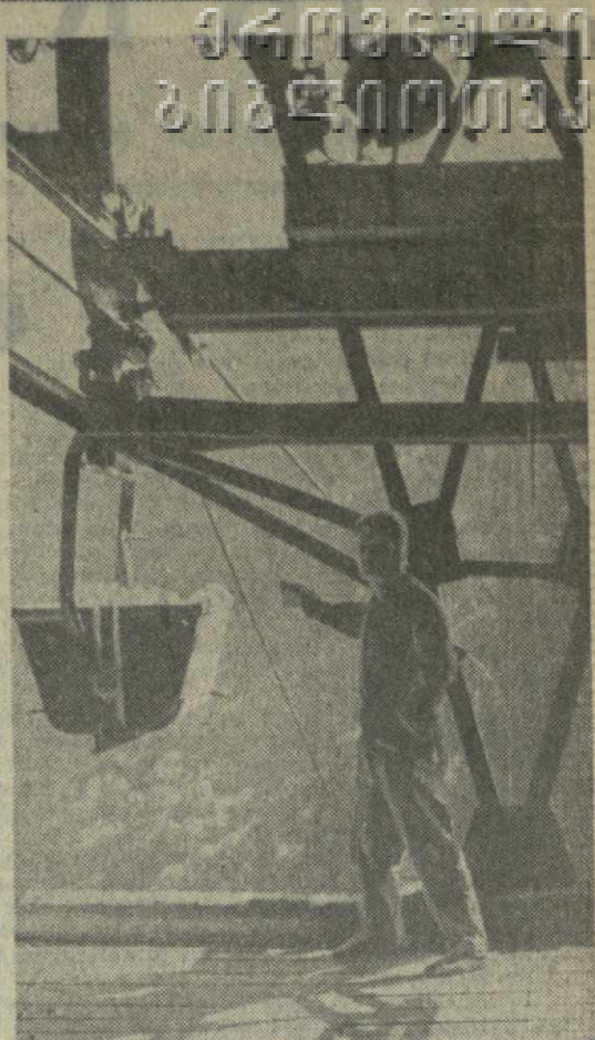
Коллектив обогатительной фабрики Чордского баритового рудоуправления из месяца в месяц добивается высоких производственных показателей. На с ним к: участок приема барита по накатной дороге.

Президиум Верховного Совета Грузинской ССР своим Указом внес изменения в Положение о Государственном флаге Грузинской ССР, утвержденное Указом Президиума Верховного Совета республики от 6 февраля 1956 года. Этим Положением определено, что Государственный флаг Грузинской ССР поднимается на зданиях всех государственных и общественных учреждений, организаций и предприятий республиканского и местного значения 25 февраля, 22 апреля, 1 и 2 мая, 7 и 8 ноября и 5 декабря. Государственный флаг Грузинской ССР разрешается поднимать на указанных зданиях, а также на жилых домах и в дни других праздников и торжественных событий. Указом Президиума Верховного Совета СССР от 4 августа 1964 года в союзное Положение было внесено изменение, выражающееся в том, что и другим праздничным дням, по которым должен подниматься Государственный флаг, добавлены 8 марта и 9 мая. В соответствии с этим Указом внесли аналогичное изменение в Положение и союзные республики. Президиум Верховного Совета Грузинской ССР своим Указом от 30 сентября 1971 года внес соответствующее изменение в Положение о Государственном флаге Грузинской ССР, выражающееся в том, что наряду с другими праздничными днями Государственный флаг поднимается также 8 марта и 9 мая. (ГрузТАГ).