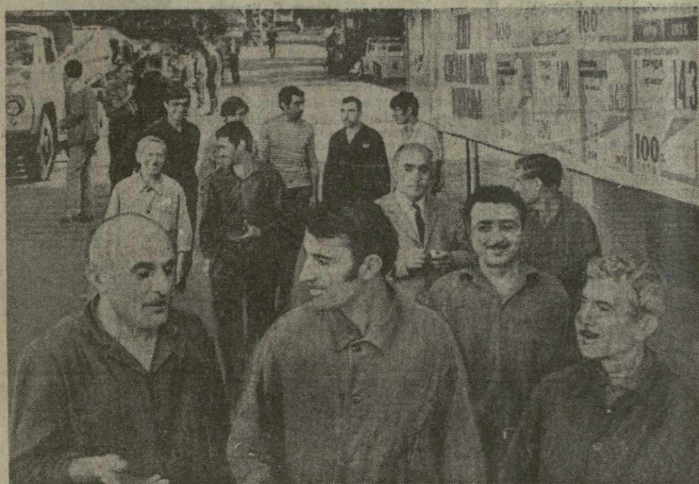
Смена идет. Позади трудовой день. И в цехе, и после работы — всегда рядом с новичками ветераны завода.

Горняки чхатарско- го рудоуправления име- ни Орджоникидзе на 13 дней раньше срока ра- портовали о выполне- нии производственного задания девяти месяцев. Добыто 272.988 тонн ру- ды, предприятие от- правлено 49.266 тонн то- варной продукции. Эти показатели намного превышают плановое за- дание трех кварталов.