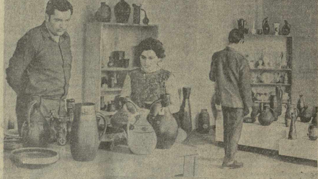
В музее Тбилисского комбината строительных материалов собраны все образцы продукции, выпускаемой предприятием. Среди них изделия, удостоенные медалей, дипломов и грамот. На снимке: в музее комбината.

В очередном матче чемпионата страны по футболу торпедовцы Москвы проиграли ташистенскому «Пахтанору» со счетом 0:1. Этот единственный гол был забит с 11-метрового штрафного удара. Алматинский «Кайрат» и команда «Равид» (Бузарест) встретились в столице Румынии в первом матче розыгрыша Кубка железнодорожников. Игра закончилась вничью — 1:1. Ответная встреча — 12 ноября в Алма-Ате. Соревнования в Бану на «Нубон СССР» — кубок «Известий» советские легкоатлеты закончили сезон нынешнего года. Среди мужчин первенствовали москвичи, набравшие 137 очков в сумме легкоатлетического многоборья, включавшего 21 вид. Столичные спортсмены вернули себе кубок, которым до этого владели ленинградцы. Первое поражение в чемпионате страны по хоккею потерпели московские спидановцы, проигравшие на своем поле воскресному «Химки» — 0:1. Результаты остальных встреч: ЦСКА — «Локомотив» (Москва) — 3:1, «Динамо» (Москва) — «Трактор» (Челябинск) — 5:3, СКА (Ленинград) — «Крылья Советов» (Москва) — 1:6.