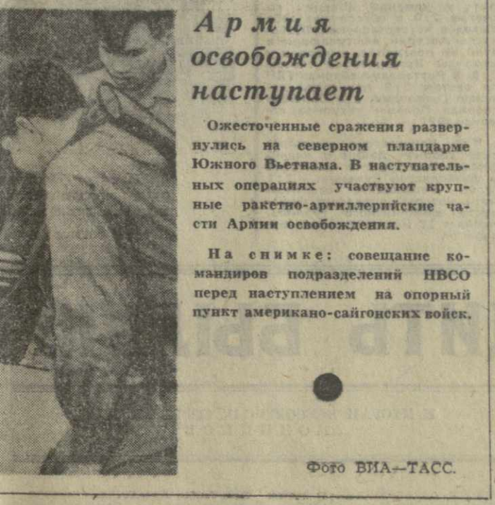
Армия освобождения наступает