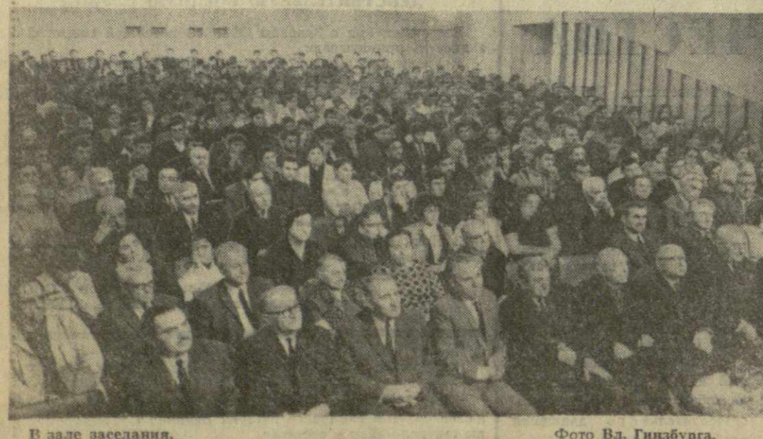
В зале заседания.