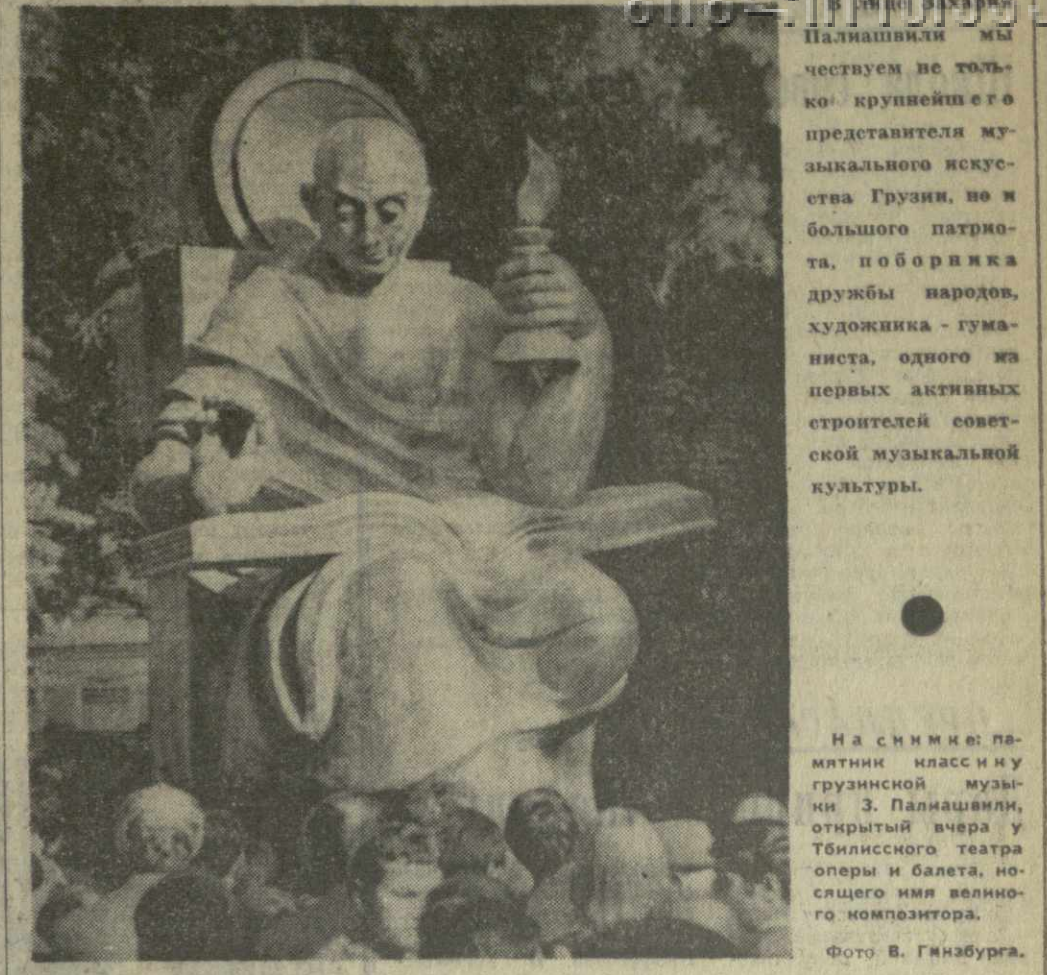
Палиашвили мы чтим не только как крупнейшего представителя музыкального искусства Грузии, но и большого патриота, поборника дружбы народов, художника-гуманиста, одного из первых активных строителей советской музыкальной культуры.