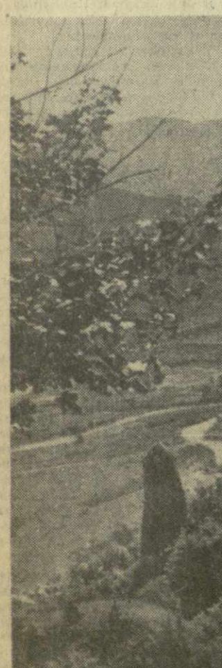
В ущелье Арагви.

КОЛЛЕГИЯ Министерства культуры СССР и Президиум Академии наук СССР приняла совместное решение об издании в союзных республиках самостоятельных Сводов памятников истории и культуры. Цель их — полная систематизация фактических данных и научных материалов о памятниках материальной культуры СССР.